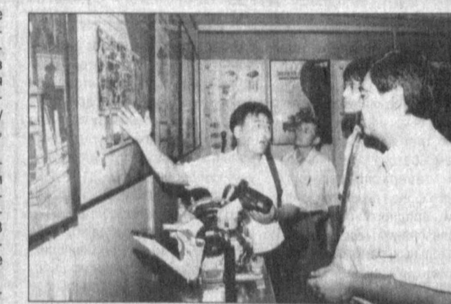
Руководитель нашего государ...