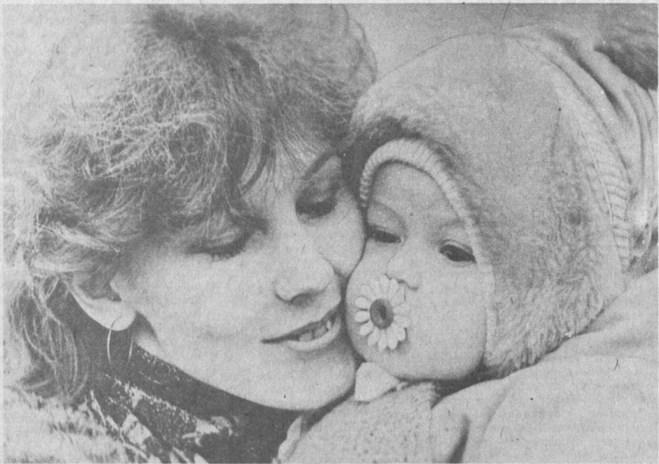
Вечная тема.