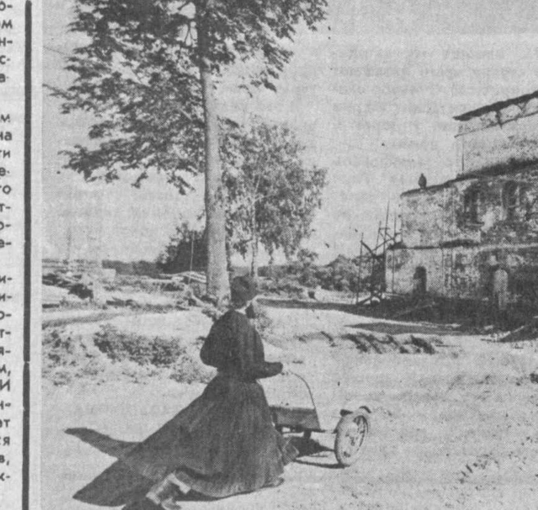
ИВАНОВСКАЯ ОБЛАСТЬ. В старинном селе Вендеево, что находится рядом с Шуей, начал возрождаться известный в прошлом на всю Россию Николо-Шартомский монастырь. Это первый и пока единственный в области мужской монастырь. Открытый после 70-летнего перерыва.

ком состоянии мы пребываем уже полгода: ни своего помещения, ни реальных средств к существованию. Спасибо Ташкентскому обществу «Мехрибонлик», которое приоткрыло нас и дало возможность как-то продержаться. Позиция, занятая нашими учредителями, некоторыми должностными лицами, которым поручено курировать УЗОИ, вполне ясна — им нет до нас никакого дела. Об этом говорит и тот факт, что работа над проектом «Закона о социальной защите инвалидов в Республике Узбекистан» ведется без участия в ней представителей инвалидов организации. Как можно решать проблемы инвалидов без инвалидов? А если сопоставить Союзный закон и республиканский проект закона, то непонятно, о какой работе над проблемами инвалидов вообще идет речь. Мало того, что республиканский проект, опровержено говоря, списан с Союзного закона, так это еще и сделано бесцеремонно, например, статья 5 проекта закона укорочена втрое, нетри соответствующей статьи закона СССР, при этом опущены абзацы затрагивающие коренные интересы инвалидов: «Государственные органы, а также предприятия, учреждения и организации независимо от форм собственности и хозяйствования при решении вопросов, затрагивающих интересы инвалидов, привлекают представителей общественных организаций инвалидов к подготовке и принятию соответствующих решений». А между тем в законе СССР сказано, что инвалиды и их законные представители имеют право участвовать в принятии решений, непосредственно затрагивающих их интересы, и получать необходимую информацию.