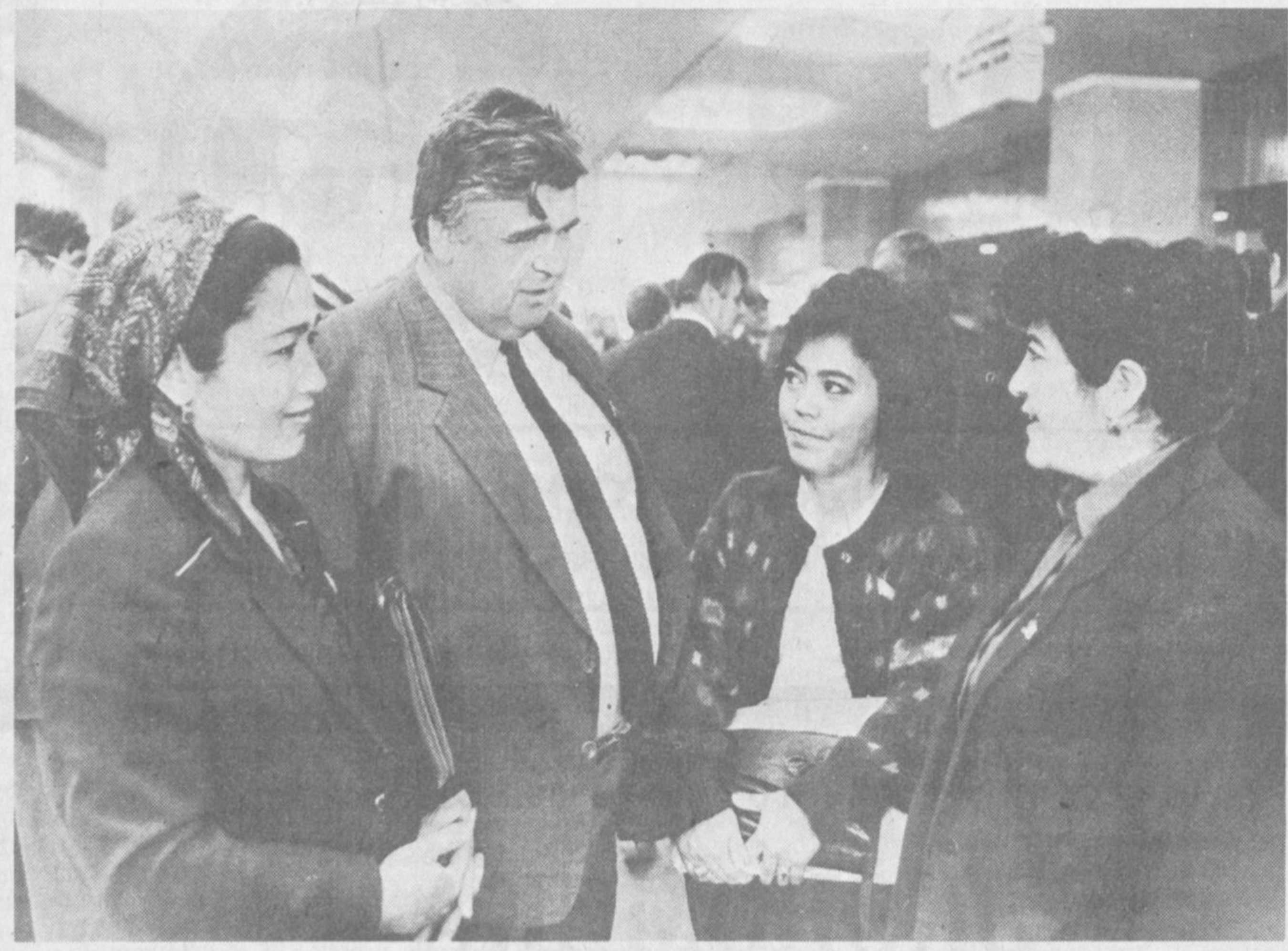
В кулуарах сессии.