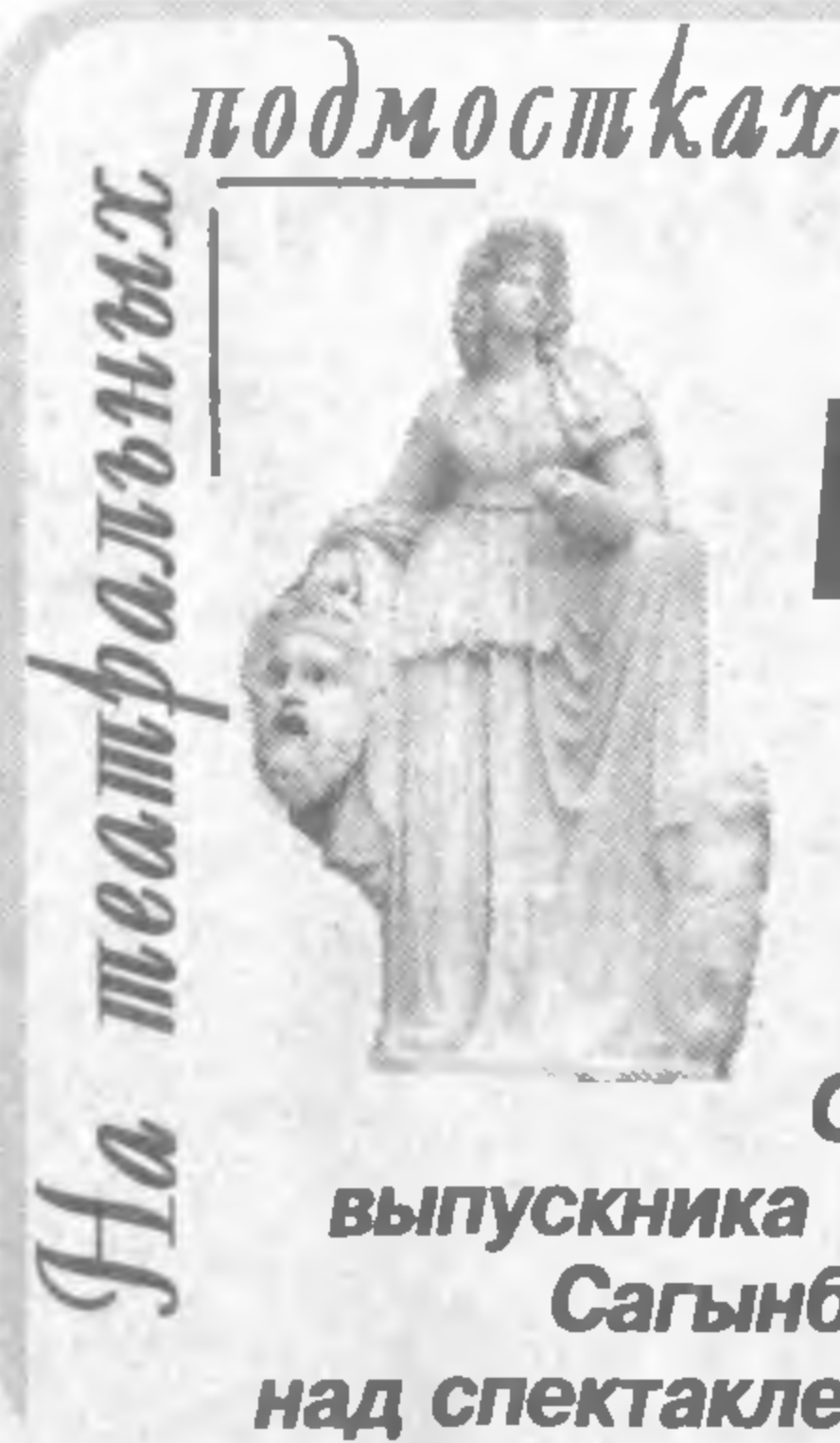
На театральных подмостках