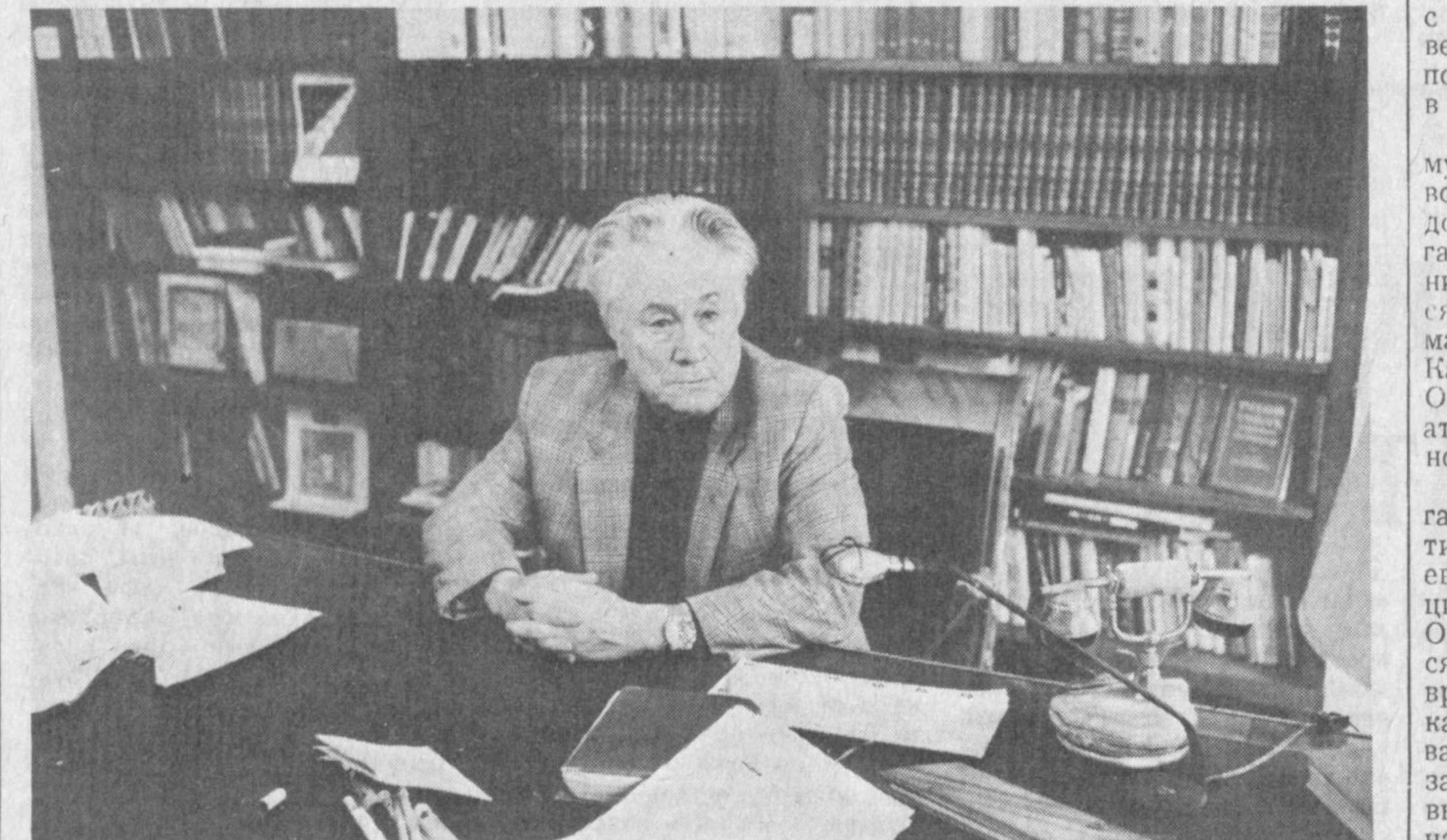
«НАИБОЛЕЕ МОСКОВСКИЙ ПИСАТЕЛЬ»

«Наиболее московский писатель» — это о Юрии Нагибине, интервью с которым открывает свой первый номер новая московская газета «Вечерний клуб», а со второго номера газета начнет публиковать цикл очерков Ю. Нагибина о Москве довоенной.