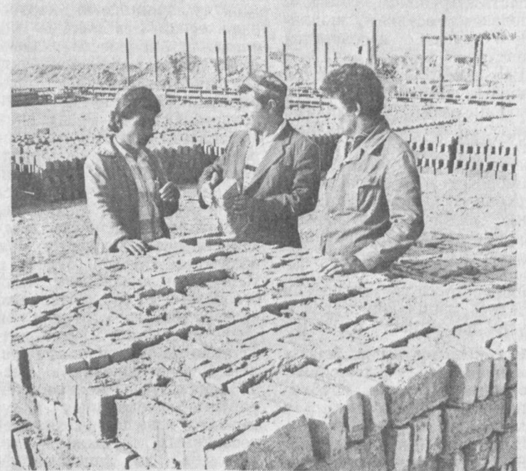
ЖИЛЬЯ БУДЕТ БОЛЬШЕ

Увеличился объем жилищного строительства в совхозе «Москва» Ульяновского района: здесь с начала года вступил в строй кирпичный завод, построенный своими силами. Произведено полтора миллиона кирпичей, который реализован рабочим хозяйством.