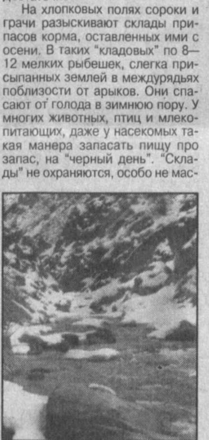
НА СНИМКЕ: в ущелье Бошкызылса.

кируются. Кто их найдет, тот и полакомится. Многие животные и млекопитающие проводят зиму в глубоком сне. Медведи, суслики, барсуки, динобарсы, а также соны, черпахи, ящерицы, змеи, лягушки и жабы проснутся и выйдут из «убежищ» только в начале марта, когда весеннее солнце пригреет землю. Такая экологическая пластичность выработана в течение длительной эволюции. В это суровое время года, когда пороша прикрывает такырные равнины и забелила снегом бурные пески Южного Кызылкума, там самая благодатная пора охоты на зайца-песчаника — пустынного толая. Особенно удачна она по первому снегу. Повсюду много следов лисид и корсаков, их еще больше чем достаточно в пустыне. А три шкурки лисицы — уже отличный малахай, который согреет голову в мороз. Опытному охотнику он обидется недорого, если учесть, что затраты только на лицензию для отстрела рыжей да на патроны. Январь для санитарной службы очень напряженное время: нужно провести учет численности мелких мышевидных грызунов. Дело это важное и нужное как в эпидемиологическом, так и в охотничье-промысловом плане. Прогноз количества мышевидных к марту — статья номер один для земледельцев, особенно в хлопкосеющей зоне: от того, каким он будет, зависит очень многое. На берегах седого Арала, просторах Устюрта, в Сурхан-Шерабадской степи, на всей территории страны царствует длинная январская ночь. Но она уже понемногу начинает сдавать позиции, и ежедневно на одну-две минутки прибавляется день. Афанасий ЛЕСНЯК, доцент, эколог.