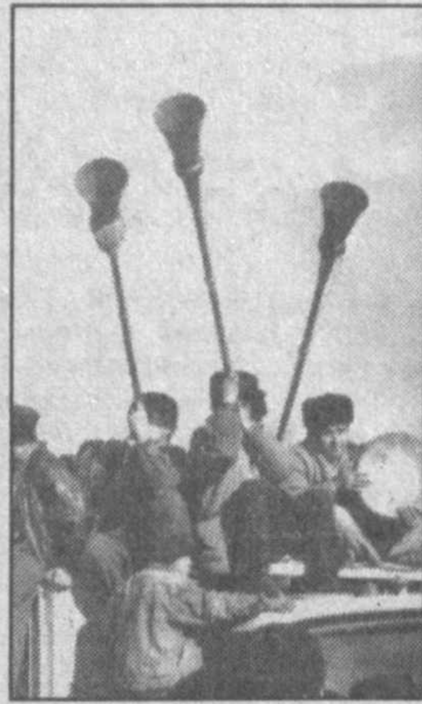
Улак — древнее конно-спортивное состязание народов Центральной Азии. У некоторых живущих здесь народностей игру называют куклари. Как правило, победителей улака — куклари принародно чествовали, они пользовались особым почетом и уважением. В те времена ни одна свадьба, другие торжества не обходились без азартной, традиционной конно-спортивной игры — улака.