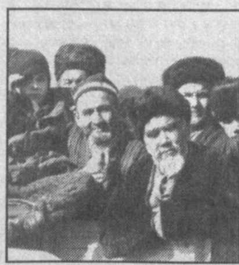
НА СНИМКАХ: конно-спортивное состязание — улак в Бавутовском районе Сырдарьинской области.

Улак — древнее конно-спортивное состязание народов Центральной Азии. У некоторых живущих здесь народностей игру называют куклари. Как правило, победителей улака — куклари принародно чествовали, они пользовались особым почетом и уважением. В те времена ни одна свадьба, другие торжества не обходились без азартной, традиционной конно-спортивной игры — улака. А в настоящее время улак как бы переживает стадию возрождения. Подтверждением этому прошедший недавно в Навои первый международный турнир по куклари. Он собрал огромное число зрителей, что свидетельствует о том, что у этой игры много поклонников. С соблюдением традиций, всех канонов и правил, сопутствующих этому состязанию, проводятся куклари в Джизакской и Сырдарьинской областях.