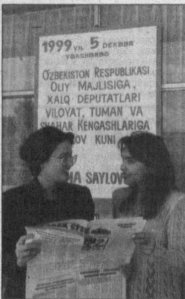
В эти дни в Навои подготовка к предстоящим 5 декабря 1999 года выборам нового состава...