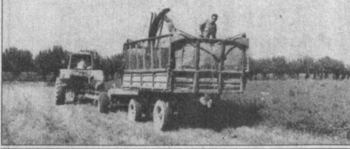
НА СНИМКАХ: механизатор Сайидмурод Зикиров; идет уборка люцерны; деканско-фермерское хозяйство Бекмухаммада Сайидрасулова стало уже школой фермерства...