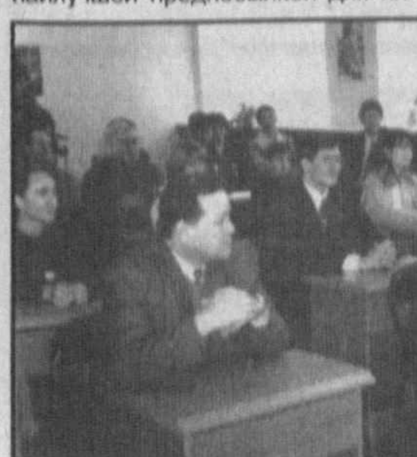
НА СНИМКАХ: во время открытия класса в бизнес-школе «Прогресс».