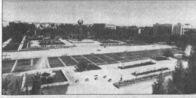
НА СНИМКАХ: спортивный комплекс "Алпомыш", Гулистан — город цветов.