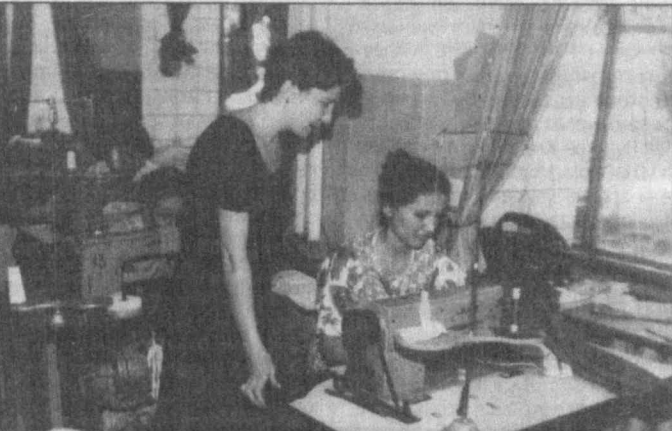
Так романтично называется коллективное предприятие ГАЖК “Узбекистон темир йуллари”, расположенное возле Северного вок-

зала столицы республики. Здесь закройщицы, швен, гладильщицы выполняют заказы железнодорожников, ташкентских