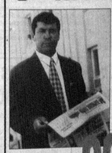
Опытный журналист легко определит деловитость того или иного руководителя, узнав, какую прессу он предпочитает, через какие каналы черпает самые свежие новости, ограничивается ли только коммерческими вестниками или его интересуют более широкий диапазон публикаций, необходимых для расширения кругозора.

но они — честные друзья, и вклад их в дело преобразования общества больше, чем у тех, кто на собраниях, совещаниях соглашается со всеми и не читает газет... Такая вот связь.