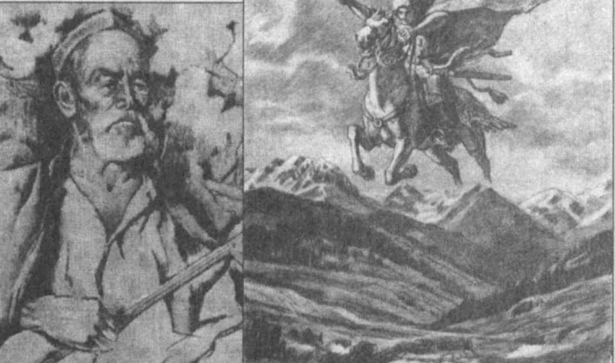
Человеку в горе — утешенье друг; Дальняя чужбина — край жестоких мук.

Краткий миг беды за время не считай, Вьюк своих обид