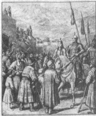
Только в наше время, в эпоху независимости Узбекистана стало возможным в максимально полном объеме — на академическом уровне, в пяти томах издать несколько вариантов знаменитого памятника фольклора узбекского народа "Алломыш" — одна из самых любимых и популярных в нашем краю героических поэм, и такой она остается на протяжении столетий.

В дни, когда у нас в стране и за рубежом широко отмечается 1000-летие узбекского народного эпоса "Алломыш" на литературных вечерах, научных конференциях, встречах, беседах в самой различной аудитории с особым благоговением вспоминаются имена выдающихся певцов-сказателей — бахши, сумевших из уст в уста передать выраженные в яркой поэтической форме бесценные крупицы мудрости поколений.