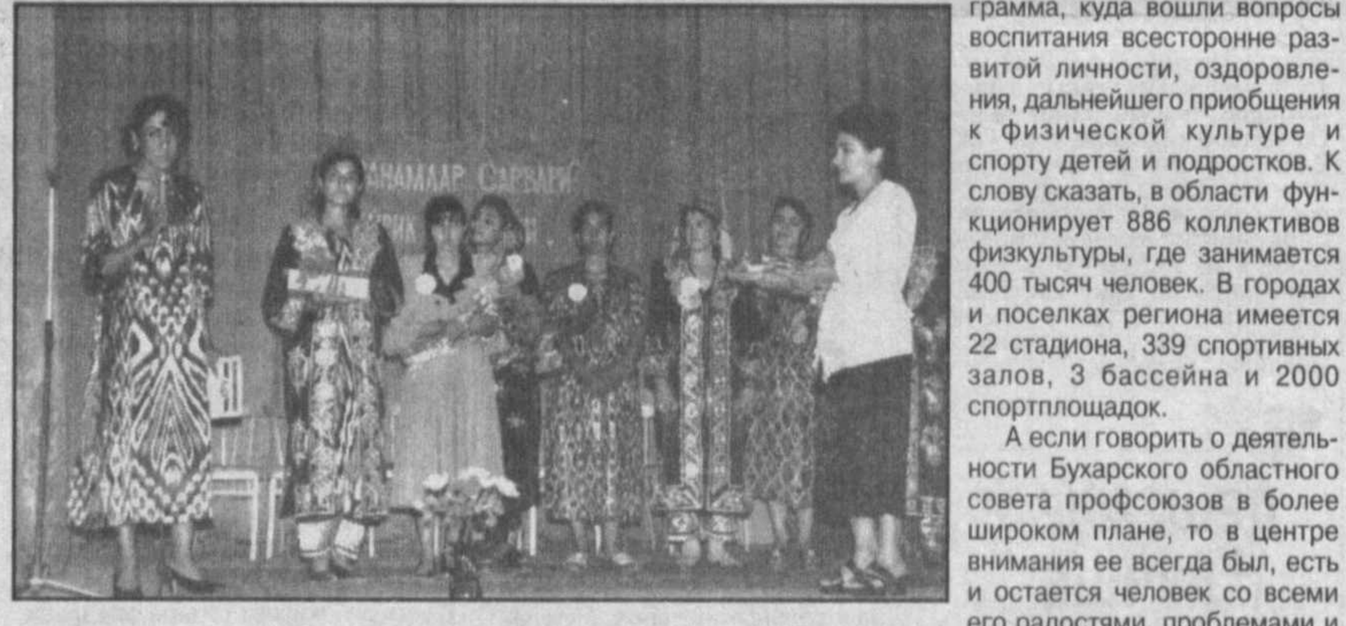
Участники конференции по вопросам улучшения положения женщин и повышения их роли в обществе. На сцене — представители различных организаций.

— Как видите, эта сумма превышает членские взносы в 14 раз. Мне кажется, это впечатляет!