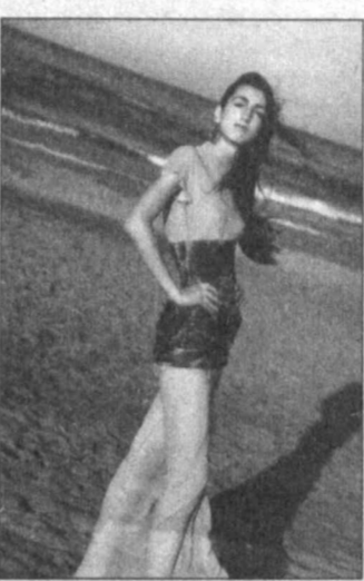
— Ваш творческий стаж — около трех лет. А сколько коллекций вы успели сделать за это время?