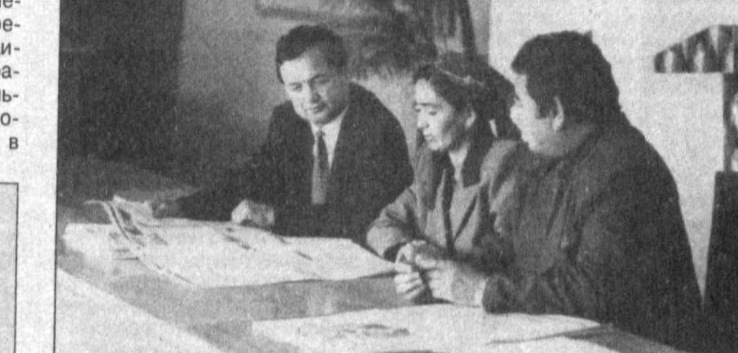
НА СНИМКЕ: в избирательной комиссии Бахмалского района можно ознакомиться со свежими новостями, почтитать правовую литературу.

Приближается 5 декабря — день выборов в Олий Мажлис, областные, районные и городские Советы народных депутатов. Готовятся к этому важному в жизни страны политическому событию и в Бахмалском районе Джизакской области. Около 47 тысяч избирателей района в этот день отдадут свои голоса за тех, кого считают самыми достойными представителями. А для 2.015 избирателей нынешние выборы — первые в жизни. Вся предвыборная работа на этом избирательном участке ведется