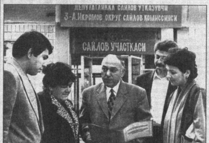
На избирательном участке № 43, расположенном в Акмал-Икрамовском районе столицы, всегда многолюдно. Сюда часто заходят жители близлежащих домов, чтобы получить интересую-