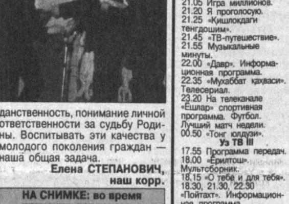
Елена ЗАПАНОВИЧ, наш корр. НА СНИМКЕ: во время вручения паспортов.

торжественное мероприятие с таким названием состоялось в Юнус-Абадском районе столицы. Главными его участниками стали семидесять подростков, жителей этого района. В их жизни начался новый отсчет — достигли шестнадцатилетия, они получили паспорта граждан независимого Узбекистана. Событие это для каждого молодого человека более чем важное. Пожалуй, начиная с него, вечерние мальчишки и девчонки по-настоящему взрослеют, чувствуют свою самостоятельность, приходят к пониманию ответственности. А потому — совсем не безразлично, в какой обстановке произойдет вручение главного документа, свидетельствующего о принадлежности к