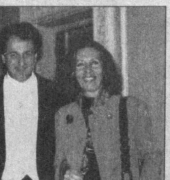
НА СНИМКАХ: ГАБТ им. А. Навои; в фойе после концерта — директор театра, народная артистка...