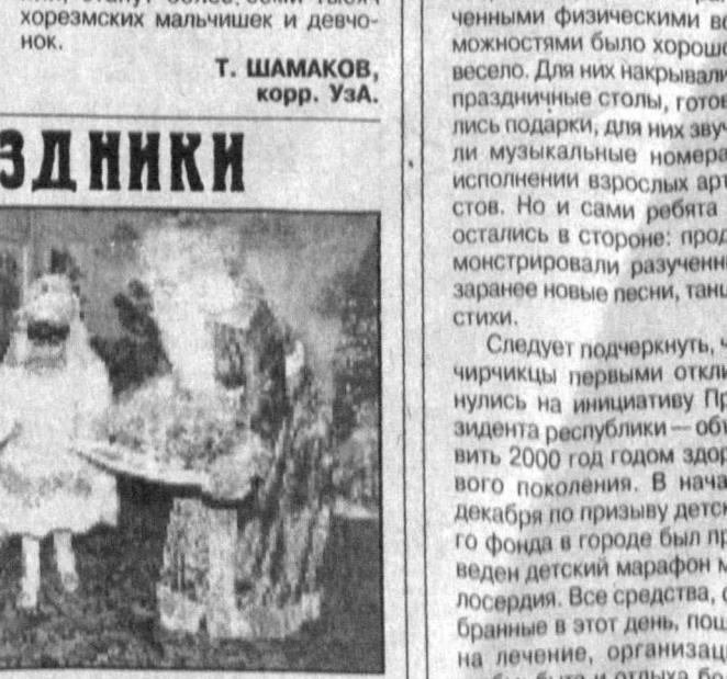
дemonстрировали свои незаурядные способности, актерское мастерство, «умение» веселиться от души. Дед Мороз и Снегурочка вручили всем ребятишкам новогодние подарки.