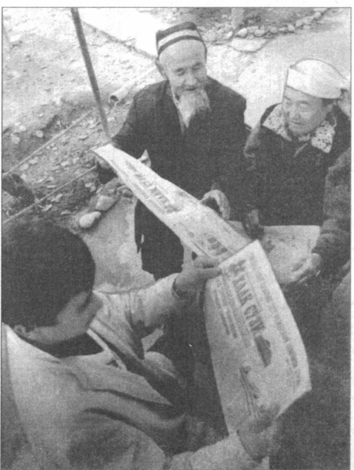
Ҳамманнинг ўз севган газетаси бўлади...