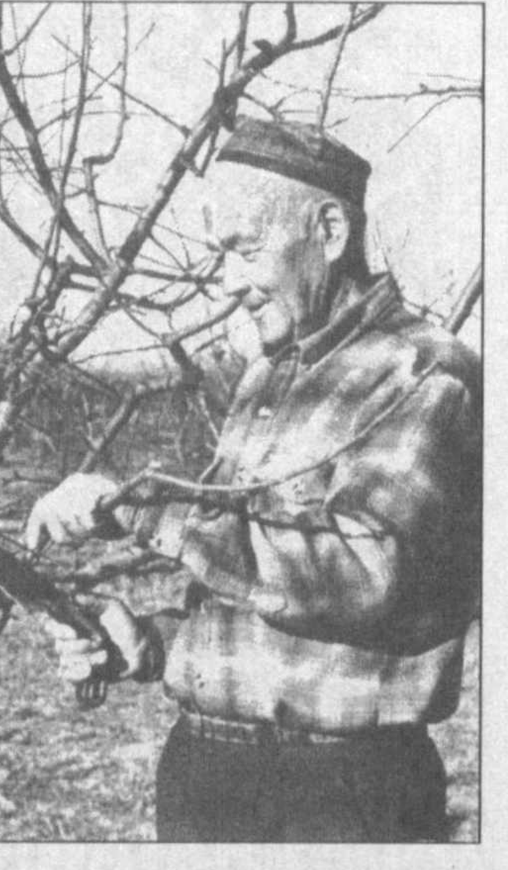
Видимо, поэтому в хозяйстве (по сравнению с соседними) неплохая заработная плата. Многие делают для создания благоприятных социально-бытовых условий работающим.

— Пора сейчас горячая. Правильно говорят в народе, что весенний день год кормит. Вот на этом пшеничном поле сегодня проводим второй этап внесения минеральных удобрений.