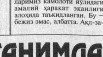
Иқтидорли талабалари топиш ва ҳар томонлама ёрдам қўлини қўшиш, уларнинг Ватанимиз раванлигига ўз ҳиссаларини қўшишига шарт яратиш долзарб вазифалардандир. Зеро, иқтидор — миллат бойлиги.

Тошкент Давлат шарқишунослик институтида иқтидорли талабаларининг илмий-амалий анжумани бўлиб ўтди. Тадбирда институтининг иқтидорли деб топилган 60 дан ортиқ талабаси ўзининг турли маъмулардаги илмий маърузаси билан иштирок этди.