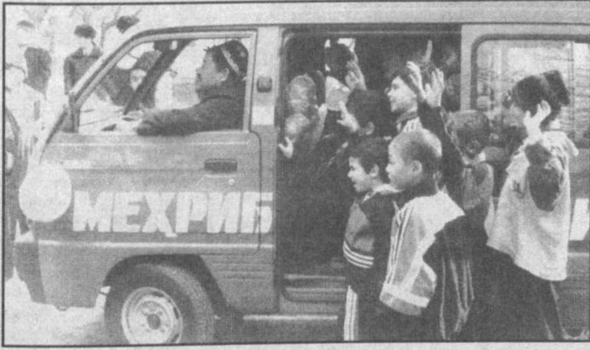
Утвердить Государственную программу "Здоровое поколение"...