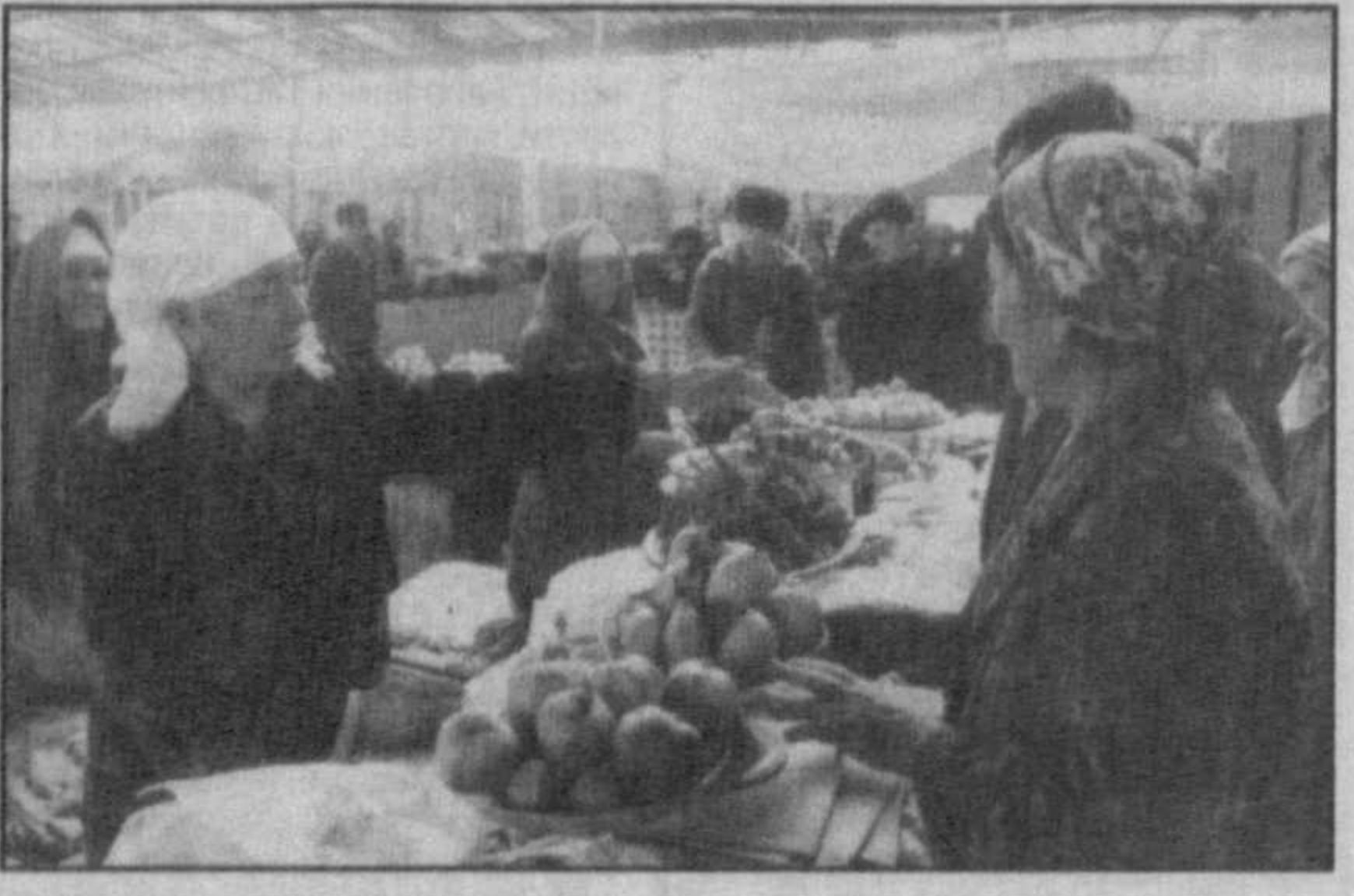
НА СНИМКАХ: в павильонах рынка АОТ "Гиждувон бозори".

Главная цель АОТ "Гиждувон бозори" — обеспечение населения региона продовольственной продукцией: бахчевыми, картофелем, фруктами, овощами, мясом, молочной продукцией. Кстати, и цены здесь значительно ниже, чем на других рынках области, потому что находятся под постоянным контролем администрации рынков. (Наш корр.).