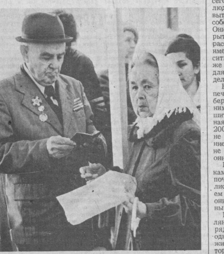
Старики... Суровы их лица. Да и чему веселиться — поводов для оптимизма почти иссякли. Они прожили долгую жизнь: выиграли войну, восстановили разрушенное войной, и были уверены всегда, светлое будущее, коммунизм. И вот — продукты картошки, купоны. Для них эти бытовые тяготы жизни, быть может, и не самое важное. Фухнуть идеями, ради которых они трудятся не покладая рук — это главное. А без идеалов жить трудно. Они должны быть, и, наверное, главный из них — общество, в котором старики не будут никому обузой.

На Чирчик-Бозсуиском водном тракте, берущем начало от Газалтинской плотины на реке Чирчик, в различные годы было построено 16 гидроэлектростанций (ГЭС), практически полностью использующих падение реки.