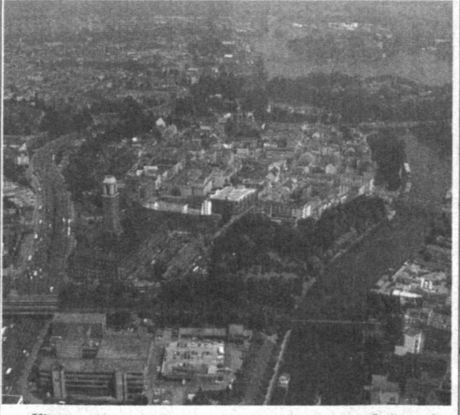
Кўркам биноларни шаҳарнинг кўрки, юзи дейишди. Бу галда жон бор. Уларни кўриб, дилнингиз яйраши, кўзингиз қувониши, табиий. Сиз суратда кўриб турган гўзал бинолар ҳам Германия ҳуснига-хусни қўшиб, кишиларнинг чинакам ҳайратига сабаб бўлмоқда.

«Қор одам» Австралияда пайдо бўлди. Ҳатто, уни ушлаган кишига 10 миң доллар ваъда қилинди. Маҳаллий аҳоли «Қор одам»ни Гаянда шаҳарчаси яқинида дарё бўйида кўрган эмис.