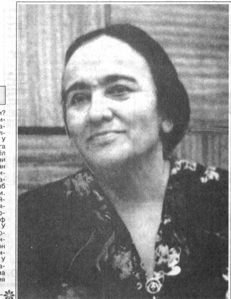
Салқин оромиди йўқолар тиңчим, Демак, шафақ мен-чун ёққилиғи бу!