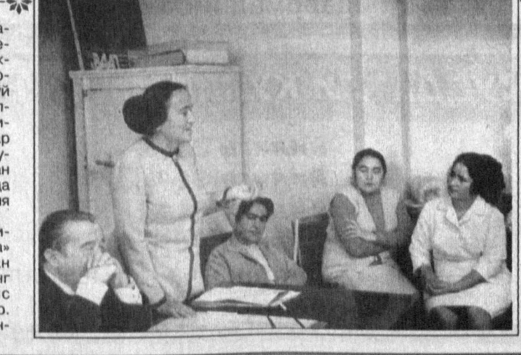
Асрларнинг индоси янраган хар парда — сатрингим,

Бахтдан, бахтсизликдан қолсам додираб, Сенга қўшиқ айтиб, сенга дейман дод, Ёнсам сун сепасан, сунсам ёдириб, Бошиңга кўтаринг онадан иёд.