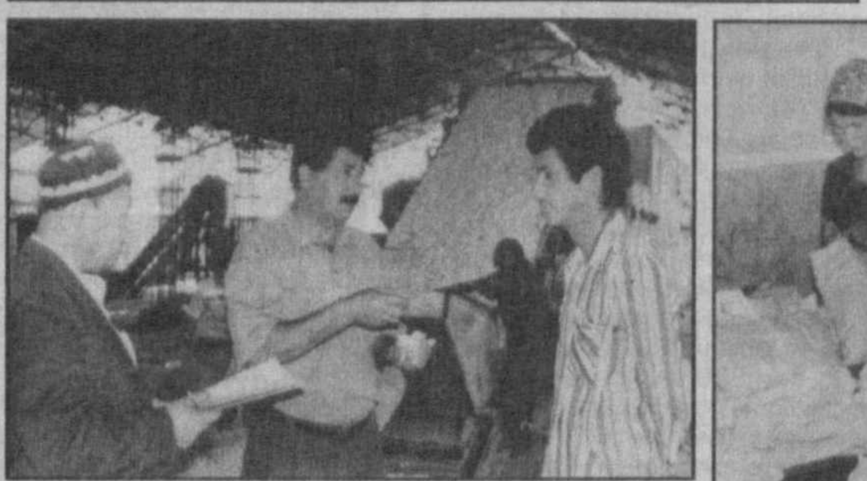
Темпы сдачи коконов — 80-85 тонн ежедневно — убеждают, что программа будет выполнена.

В разгаре «шелковая» страда у труженников Ангорского района. С 2,300 коробок гренны здесь планируют получить 115 тонн коконов.