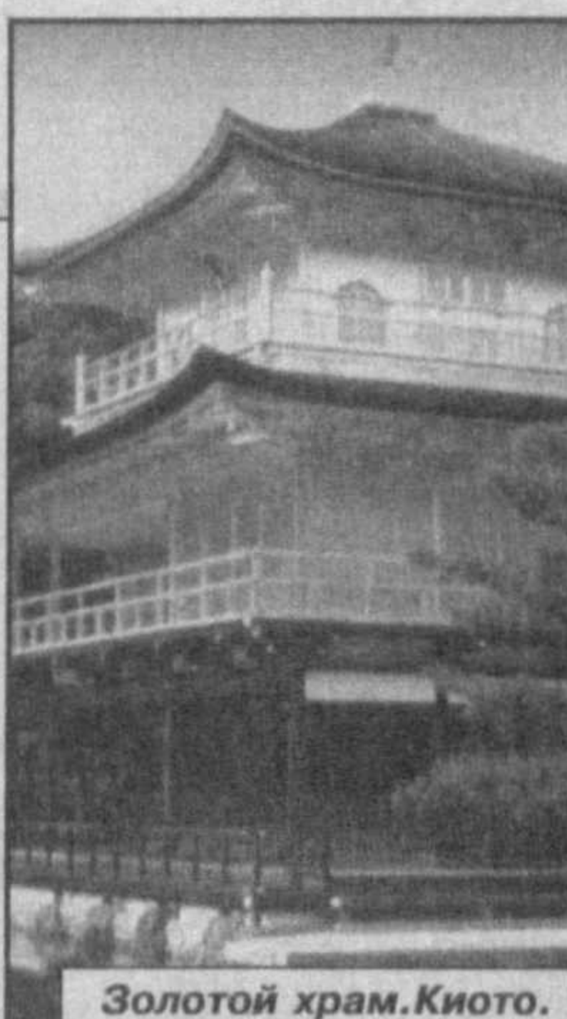
Золотой храм Киото.