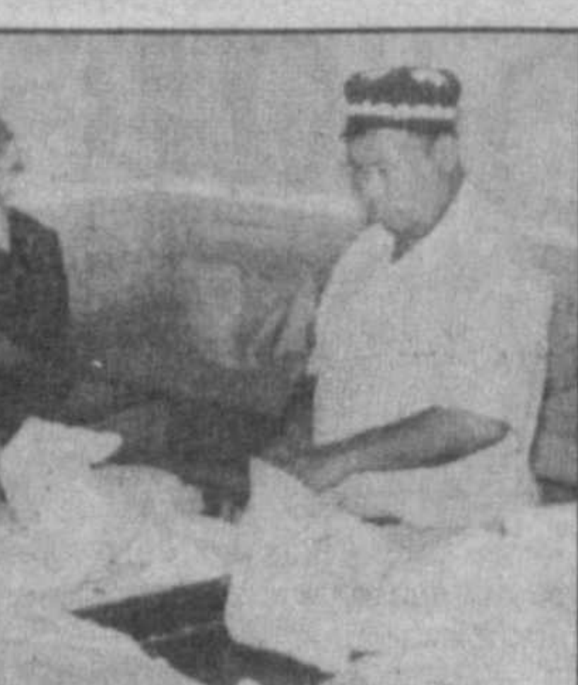
Темпы сдачи коконов — 80-85 тонн ежедневно — убеждают, что программа будет выполнена.

Хозяйства Сурхандарьинской области в нынешнем году взяли на откорм 21,200 коробок гренны тутового шелкопряда.