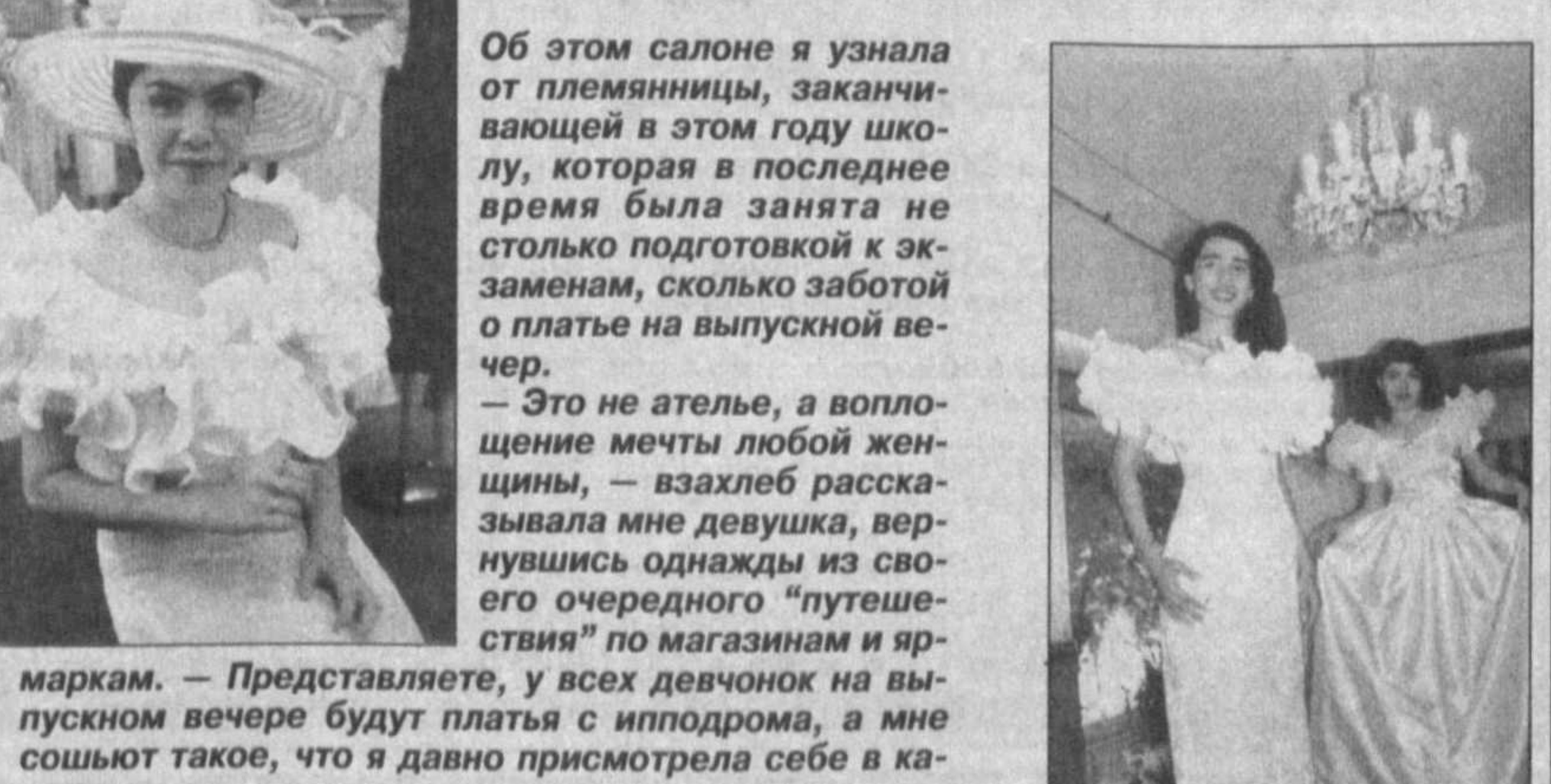
Об этом салоне я узнала от племянницы, заканчивающей в этом году школу, которая в последнее время была занята не столько подготовкой к экзаменам, сколько заботой о платье на выпускной вечер.

— Это не ателье, а воплощение мечты любой женщины, — взахлеб рассказывала мне девушка, вернувшись однажды из своего очередного "путешествия" по магазинам и ярмаркам. — Представляете, у всех девочек на выпускном вечере будут платья с ипподрома, а мне сошью такое, что я давно присмотрела себе в каталоге.