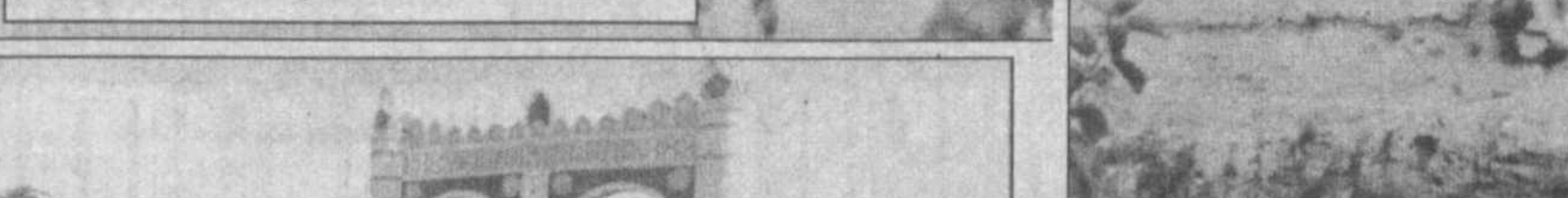
Эти древние стены — память об истории края.