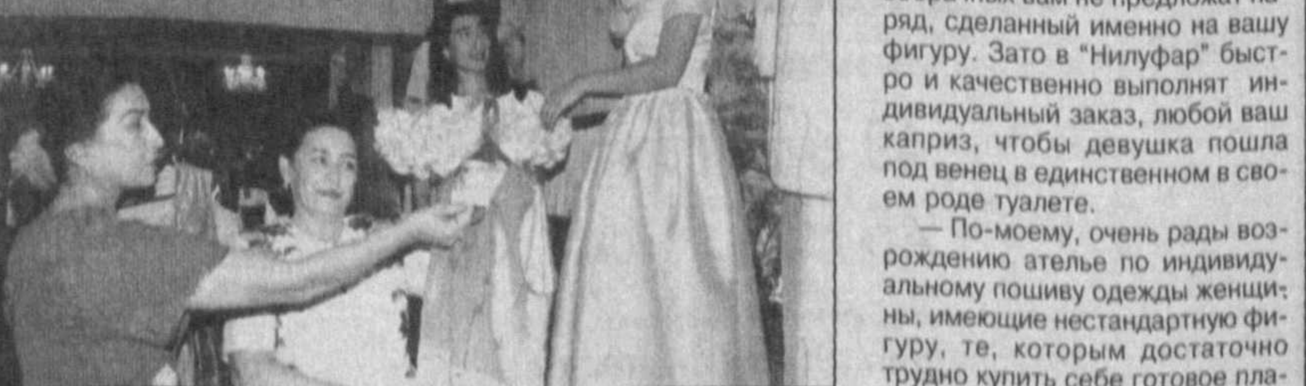
Сами понимаете, после такой характеристики, пожалуй, ни одна женщина не сможет удержаться от посещения столь соблазнительного заведения.

— Это не ателье, а воплощение мечты любой женщины, — взахлеб рассказывала мне девушка, вернувшись однажды из своего очередного "путешествия" по магазинам и ярмаркам. — Представляете, у всех девочек на выпускном вечере будут платья с ипподрома, а мне сошью такое, что я давно присмотрела себе в каталоге.