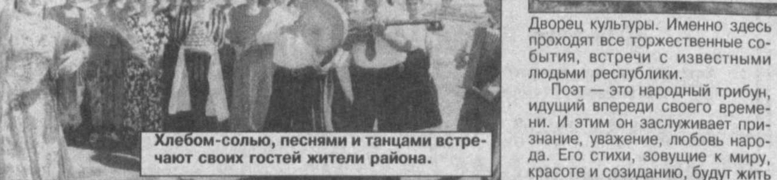
Хлебом-солью, песнями и танцами встречают своих гостей жители района.