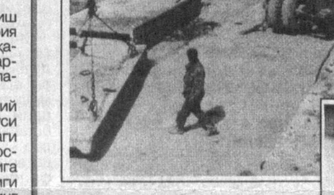
Кизилқум Саҳроси ўзгармоқда