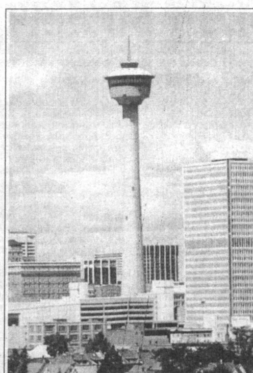
Канададаги Торонто телеминораси.

Маълумки, Жанубий-Шарқий Осиёдаги молиявий бўҳрон оқибатида 1998 йилда Жанубий Кореяда иқтисодий ўсш курсаткичи бир оз тушиб кетганди. Уша йилги курсаткичи манфий 5,8 фоизни ташкил этганди. Аммо ўтган йилги мамлакатда иқтисодий ўсш курсаткичи 10,2 фоизни ташкил қилди. Бу мамлакат ҳукумати кутганидан анча кўч. Ушбу юқалиш Европа Иттифоқи эътирофига ҳам сабаб бўлди. Кунги кеча Жанубий Корея президенти Ким Дэ Чжуннинг Европа давлатлари бўйлаб бошланган сафарларида бу ҳақда алоҳида таъкидланди. Айни пайтда жаҳон оммавий ахборот воситалари мазкур сафарга алоҳида эътибор қаратмоқда. Зеро, Европа Иттифоқи билан иқтисодий ҳамкорлик Жанубий Корея учун муҳим аҳамият касб этади. 370 миллионлик аҳолиси бўлган Европа Иттифоқи Жанубий Корея учун йирик экспорт бозоридир. Масалан, ўтган йили Жанубий Корея билан Европа Иттифоқи ўртасидаги савдо-сотиқ ҳажми 29,65 миллиард АҚШ долларини ташкил этган. Мазкур сафарнинг сийосий жиҳатлари ҳам йўқ эмас. Шу йилнинг октябр ойида "Осиё-Европа" саммити Сеулда бўлиши кўтилмоқда.