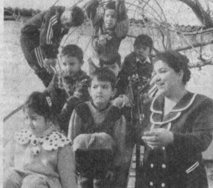
СУРАТДА: Умидахон катта гуруҳ болалари билан машғулот ўтказаятган пайт.

Тарбиячи бўлишни у болалардан орзу қиларди. Шу боис ўрта мактабни тугатиши билан сира иккиланмай педагогика билим юртига ўқишга кирди.