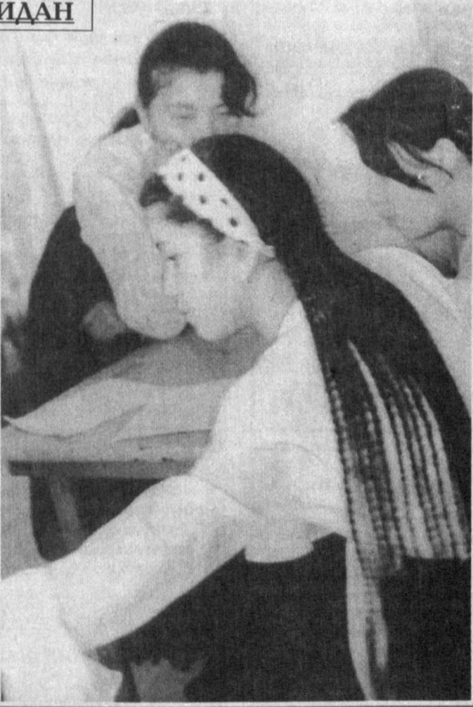
Гапни гапир уққанга...

Қайсики уйнинг пештоқида қалдирғоч ин қурса, ўша хона-донда тинчлик-хотиржамлик, кут-барака ҳукм сурармиш. Бу йилги мактаб битирувчиларини ҳам, таъбир жоиз бўлса, худди ўша эзгулик элчиларига мен-гаш мумкин. Юртимизнинг му-саффо осмонига учирма бўла-ётган қалдирғочлар... Парвозга шай қалдирғочлар... Уларга бе-хатар парвоз, ҳаёт синовлари-дан ўтишда муваффақиятлар ти-лаймиш.