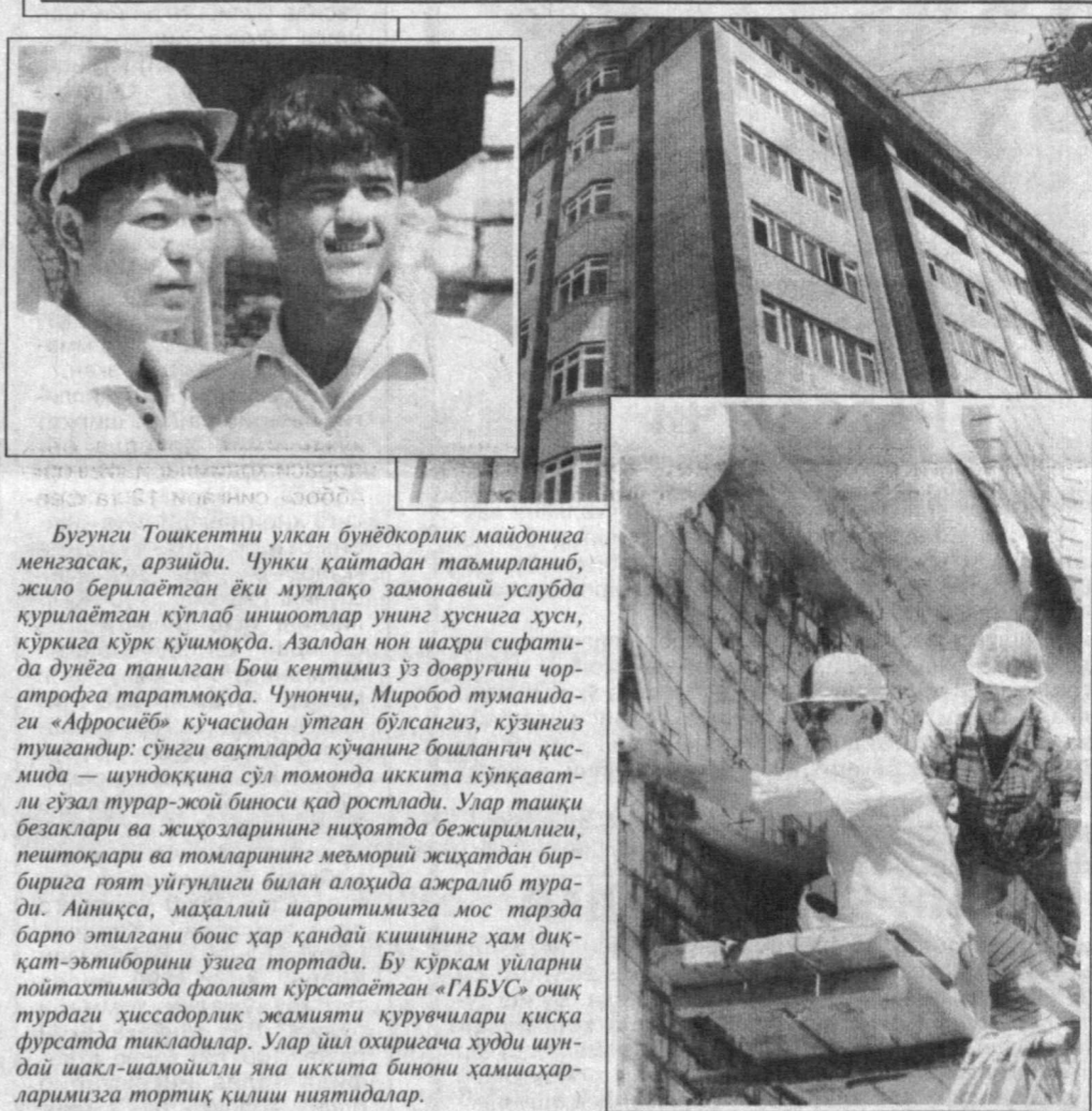
Буёғини Тошкентни улкан бунёдкорлик майдонига менезасак, аршиди. Чўнки қайтадан таъмирланиб, жисо берилаётган ёки мўлақоқ замонавий услубда қўпилаётган қўпилаб ишоотлар унинг ҳўсиёга ҳўси, қўрқиса қўрқ қўпишмоқда. Азалдан нон шахри сифатида дўғега танилган Бош кешими ўз доғруғини чоратрофа таратмоқда. Чўнончи, Миробод туманидаги «Афросиёб» қўчасидан ўтган бўлсангиз, қўғини тўғиландир: сўғиё вақтларда қўчанин бошлангич қисмида — шўдиқўғина сўз томонда иқтиса қўқаватли гўзал турар-жой биноси қад ростлади. Улар ташқи безаклари ва жўқозарининг ниҳоятда бежириллиги, пештоқлари ва тоғларининг меъморий жўқатдан бири бирига гўят уйғунлиги билан алоҳида ажрлиб турди. Айниқса, маҳаллий шароитимизга мос тарзда барто этилгани боис ҳар қандай қишининг ҳам диққат-эътиборини ўзиса тартиди. Бу қўрқам ўларни пойтахтимизда фаолият кўрсатаётган «АБЗ» ошқ тўғида ҳўссадорлик жамияти қўрқувчилари қисқа қўрқатда тикландилар. Улар йил охирида худди шундай шақс-шамошли янги иқтиса биноси ҳаммаҳарларимизга тортиқ қилиш ништилалар.