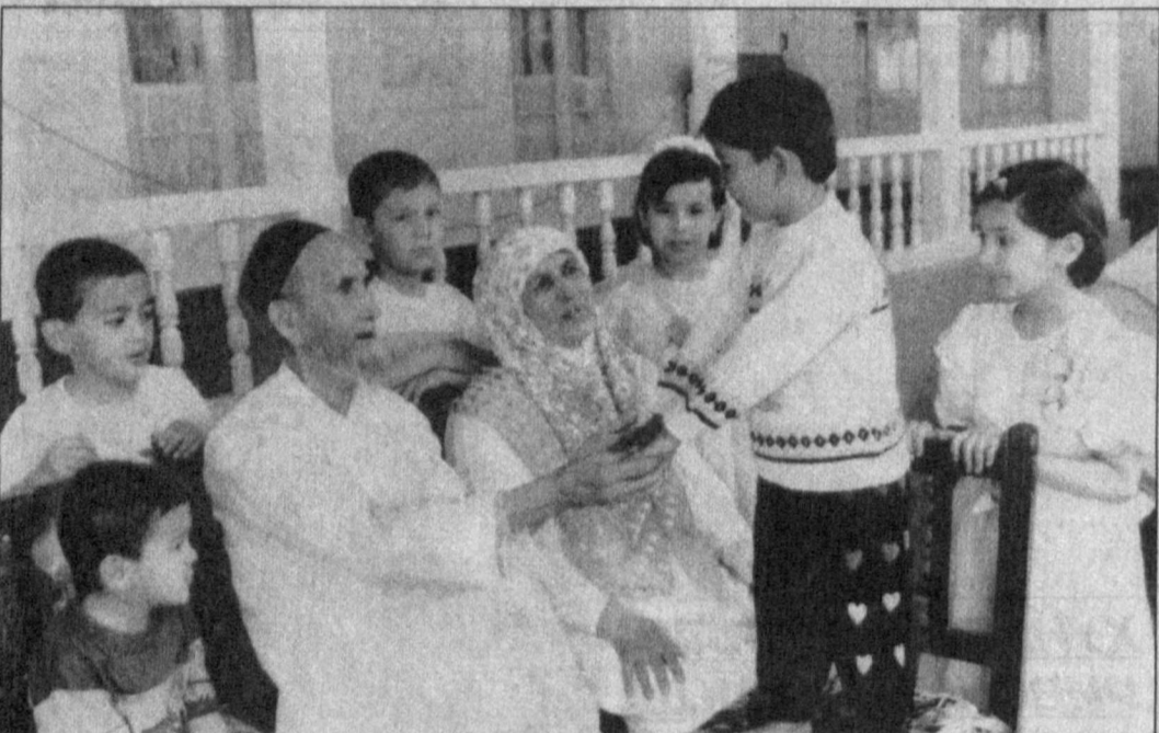
Пиру бадавлатлар.