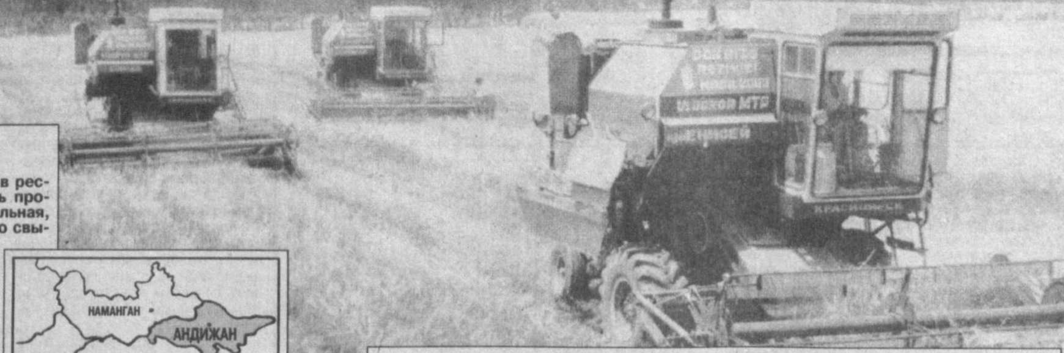
Зерноводы Андижана в числе первых в республике выполнили годовой заказ по заготовке хлеба...