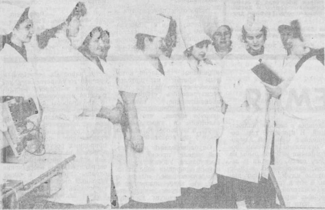
Одни из лучших

На том же Алайском рынке выставлены в павильон «Израуш» «ташполдовоц». Осмотр выставленных продуктов разочаровывает. Фруктов не увидишь, а овощи хоть и недороги, но не первой свежести. И понятно, почему: торговый зал павильона пустует: покупатель обходит павильон. Резюмируя сделанные наблюдения, стоит поразмыслить, во что выливается приватизация госторговли и рынка. Ведь исход его затрагивает интересы многоконтинентного населения Узбекистана. Длительное монополистическое положение госторговли, усугубленное экономическим кризисом, обнуляет ее вкладом. Знание пустоты полки магазинов — красноречивое его проявление. Сможете ли госторговля, приспособившись к изменившейся экономической ситуации, возродиться к новой жизни? Такой поворот дел вероятен. Но при всех вариантах процесс