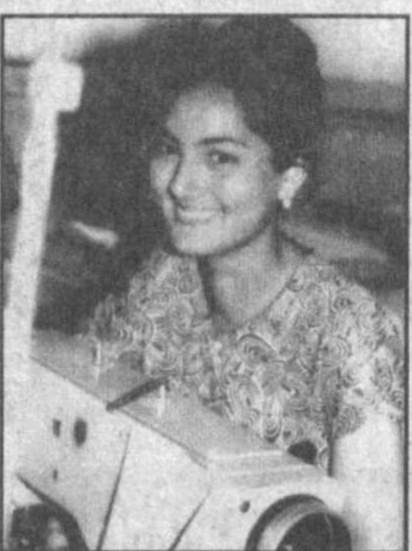
ПОЛОН ПОРТФЕЛЬ ЗАКАЗОВ

Можно много говорить и о других наших музыкально-творческих победах и достижениях последних лет, трудностей и проблем у наших музыкантов тоже есть немало, и все мы являемся свидетелями, как эти трудности постепенно пре-