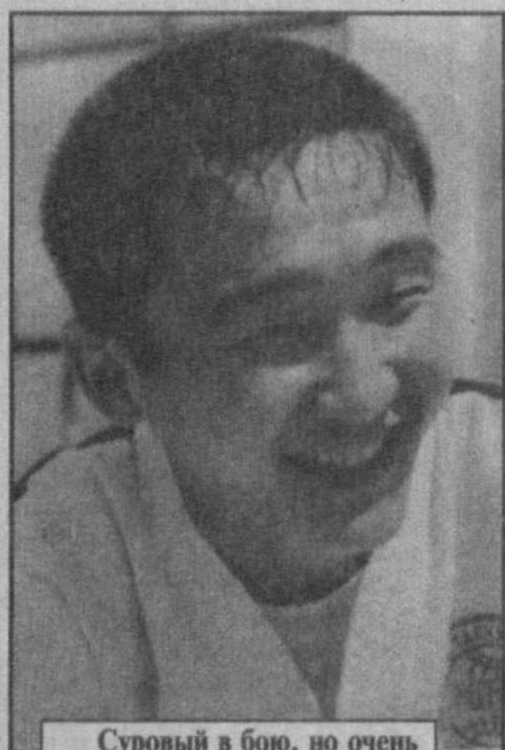
Суровый в бою, но очень веселый в жизни человек — таким знают чемпиона мира по тэквондо Владислава Нама.