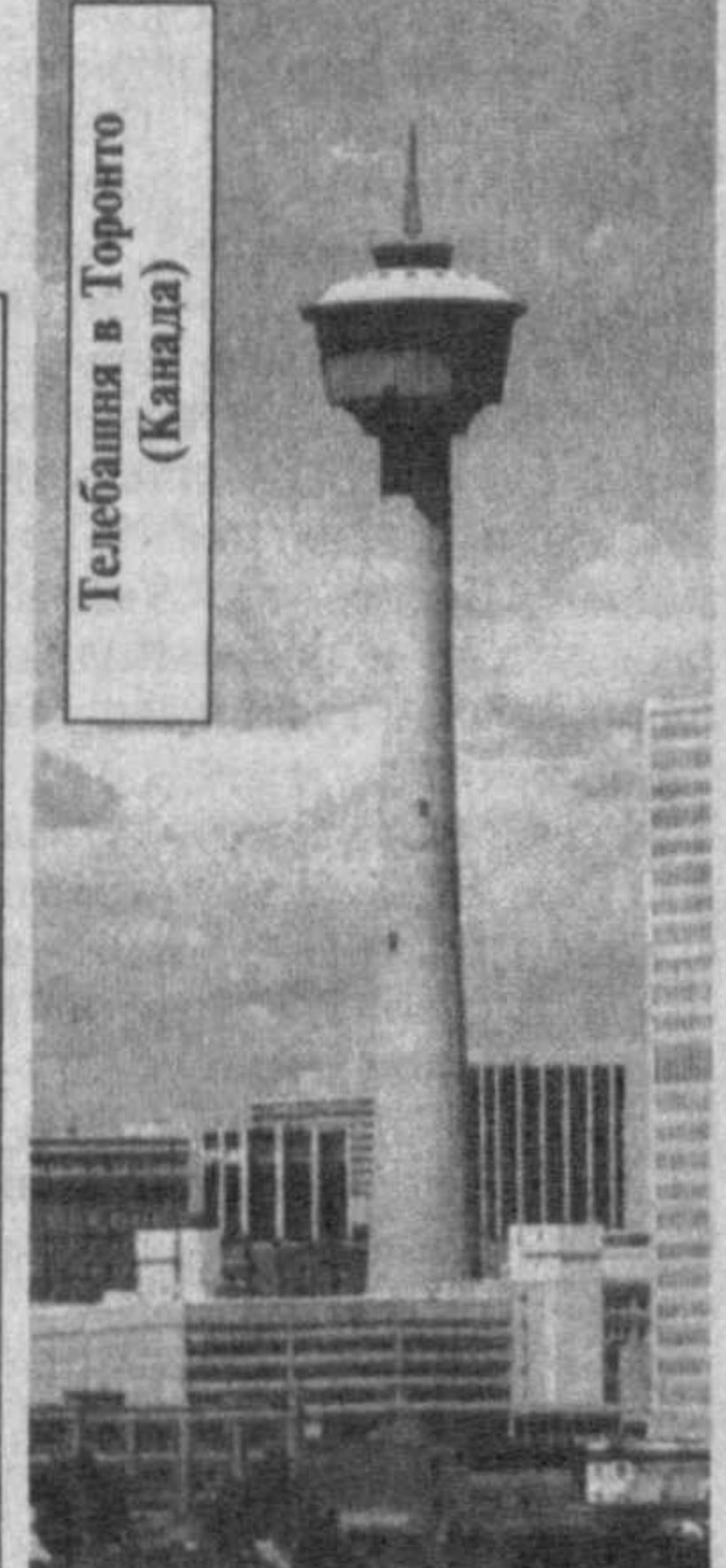
По материалам зарубежных информационных агентств.

Германо-американский автогигант «Даймлер-Крайслер» разработал две экспериментальные модели автомобилей с использованием «вторичных материалов». Об этом сообщил представитель штаб-квартиры концерна в Штутгарте (федеральная земля Баден-Вюртемберг), подчеркнув, что этому направлению сегодня придается первоочередное значение. В новых моделях используются материалы, полученные в результате переработки пластиковых и стеклянных бутылок, пенопласта, автомобильных шин и текстильных изделий. По оценке экспертов «Даймлер-Крайслер», к 2002 году концерн сможет производить автомобили, 85 процентов веса которых будут составлять материалы, пригодные для повторного использования, а к 2005 году этот показатель составит уже 95 процентов.