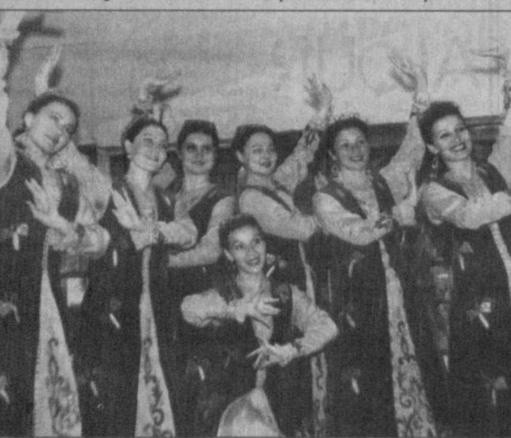
Подборку подготовил Вадим ГЛАДИЛОВ , наш специальный корреспондент.