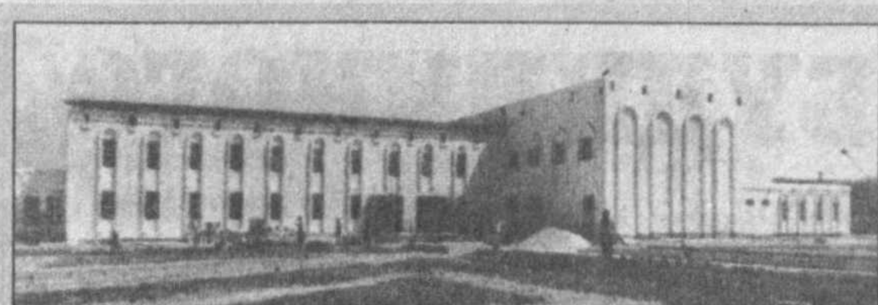
С широким размахом ведутся в последние годы в Джизакской области строительные и благоустроительные работы. Итогом их стали десятки административных зданий, жилых кварталов, промышленных, водохозяйственных объектов.

Своей трудовой подарок подготовили джизакцы к дню празднования 9-й годовщины независимости. В Дустикском районе будет сдано в эксплуатацию здание сельскохозяйственного колледжа на 600 учащихся, общежитие на 100 мест. Стоимость объекта — 450 миллионов сумов, в его возведении участвуют строители ПМК “Дустлик” треста “Джизаккудтуриш”, другие строительные коллективы. Сейчас здесь ведутся отделочные работы.