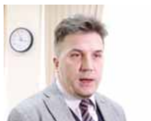
Фабрицио ВЬЕЛМИНИ, сиёсий эксперт (Италия):

янада самарали бўлишни режалаштиришга тўғри келди. Кўшни Афғонистонга ҳам дахлдорлик мазкур нуфузли тадбирнинг яна бир муҳим жиҳатидир. Зотан, ушбу давлат ҳам минтақанинг бир қисми бўлиб, Марказий Осиёдаги барча мамлакатлар Афғонистонни иқтисодий ривожлантириш ва у ердаги тинчлик жараёнлари йўлида ўзаро ҳамкорлик қилишдан манфаатдордир. Бундай мулоқотлар ҳар йили бўлади, деб ўйлайман. Улар ҳам Президентлар, ҳам вазирлар, ҳам жамоатчилик ва хусусий ташкилотлар даражасида ўтказилади. Албатта, миллий манфаатларга зарар етказмаган ҳолда минтақавий даражада фикрлашни бошлаш керак. Яна бир бор тақрорлайман, мен учун бу жуда катта таассурот қолдирган воқеа бўлди ва 2019 йил 29 ноябрь Марказий Осиёдек буюк минтақанинг қайта туғилиш санасига айланди. Бу Марказий Осиёдаги ҳар бир мамлакатнинг миллий байрамига айланishi лозим.