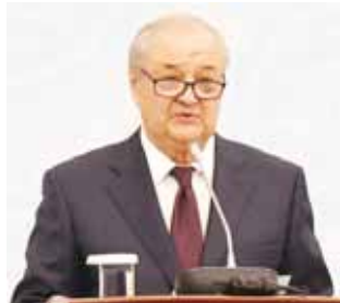
Абдулазиз КОМИЛОВ, Ўзбекистон Республикаси ташқи ишлар вазир:

ташқи иқтисодий алоқалари сезиларли равишда ўсди. Афғонистон орқали Покистон денгиз портлари ва Ҳинд океани хавзаси давлатларига йўл очилади. Оқ уй раҳбарининг яқинда қўшни Афғонистонга ташири унинг ушбу мамлакатда тинчлик ўрнатишга тайёр эканлигини намоён этди. Марказий Осиё мазкур минтақа халқлари учун катта иқтисодий ва ижтимоий фойда келтирадиган йирик бозорни ўзида ифодалайди. Уйлашимча, Маслаҳат учрашувида ушбу беш давлат ўртасида бу борада мавжуд бўлган айрим чекловлар кучсизлантирилган. Ўз навбатида, ушбу мамлакатлар аҳолисининг минтақа ичида ҳаракатланиши осонлашди, бундай ҳолат Марказий Осиёда туризмини сезиларли даражада яхшилашга олиб келади. Қолаверса, бу давлатлар нафақат минтақа, балки бутун Евроосиё маконига иқтисодий салмоғини оширган ҳолда ўзаро фойдали савдо ҳамкорлигини йўлга қўя олишди.