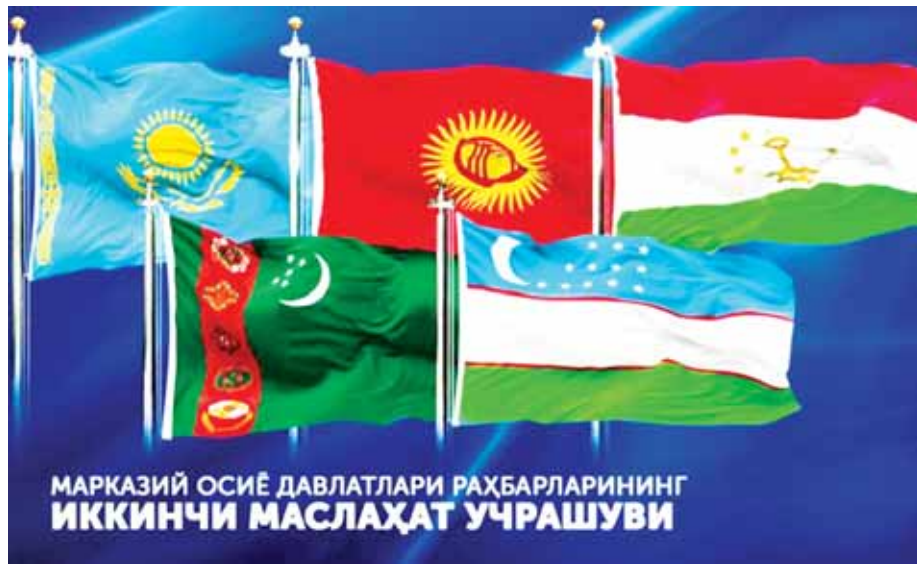
МАРКАЗИЙ ОСИЁ ДАВЛАТЛАРИ РАҲБАРЛАРИНИНГ ИККИНЧИ МАСЛАҲАТ УЧРАШУВИ

Аввал хабар қилингандек, 2019 йил 29 ноябрь кuni Тошкентда Марказий Осий давлатлари раҳбарларининг Маслаҳат учрашуви бўлиб ўтади. Ўзбекистон Республикаси Президенти Шавкат Мирзиёев ташаббуси билан ишончли мулоқотни амалга ошириш ва минтақанинг долзарб масалаларига биргаликда ечим топиш мақсадида мазкур форматдаги учрашувлар йўлга қўйилган.