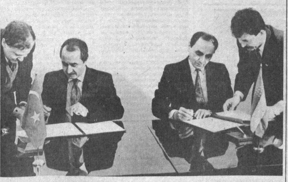
ТАШКЕНТ. Первый заместитель министра иностранных дел Республики Узбекистан Фатых Тешабаев и министр иностранных дел Турецкой Республики Хикмет Четин подписали протокол об установлении дипломатических отношений.

высокоразвитых стран мира. В этом мы окажем народу Узбекистана всяческую помощь и поддержку, сказал гость из Турции.