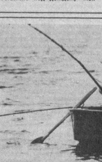
Нет, это не забава — это часть жизни человека. И счастье то, что хоть иногда выплывает на лодке ранним утром на середину озера...

Озеро... Кто хотя бы раз бывал на заре у его берегов, вряд ли когда забудет непередаваемые запахи и звуки — оно как живой организм, только в отличие от человека в нем все органично.