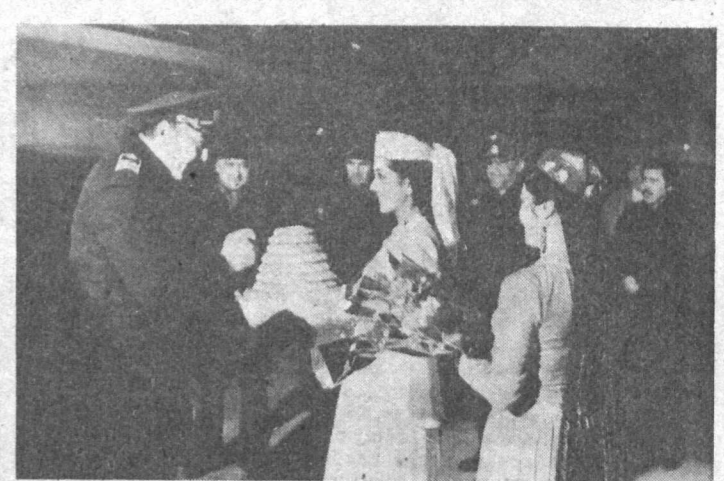
ТАШКЕНТ. Глубокой ночью четыре большегрузных лайнера ИЛ-76 национальной авиакомпании «Узбекистон хаво йуллари» приземлились в аэропорту столицы республики. Они доставили к всенародному вразнику Наурузу первые 160 тонн груза гуманитарной помощи Турции Узбекистану. Экипажи самолетов были встречены хлебом-солью. Всего до 15 марта из Турции по авиамосту Ташкент-Анкара будет перебронировано 5,200 тонн продуктов питания, медикаментов, промышленных товаров.