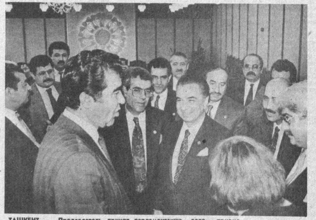
ТАШКЕНТ. Председатель Верховного Совета Республики Узбекистан Ш. М. Юлдашев принял парламентскую делегацию Турции. НА СНИМКЕ: во время приема.

В это время открытой дружеской беседы, которая продолжалась более двух часов. Президент подробно рассказал гостям о политической, экономической и социальной обстановке в Узбекистане.