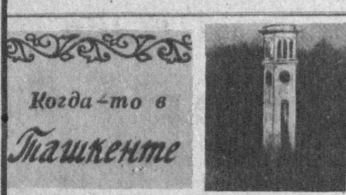
Когда-то в Ташкенте