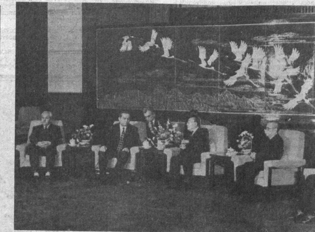
Китайская Народная Республика. Здесь с официальным визитом побывала правительственная делегация Республики Узбекистан во главе с Президентом И. А. Каримовым. НА СНИМКЕ: во время переговоров Президента Республики Узбекистан И. А. Каримова с председателем КНР Ян Шаньюем.

Правительственная делегация Республики Узбекистан во главе с Президентом И. А. Каримовым после завершения официального визита в Китайскую Народную Республику 14 марта возвратилась в Ташкент. В Ташкентском аэропорту члены делегации встречали Председатель Верховного Совета Республики Узбекистан Ш. М. Юлдашев, премьер-министр Республики Узбекистан А. Муталов, другие официальные лица. Среди встречавших находился временный поверенный в делах КНР в Узбекистане Ли Чжэньхуа. У трапа самолета И. А. Каримов от себя лично и от имени других членов делегации выразил глубокую удовлетворенность итогами визита. Открыта новая страница в истории наших взаимоотношений с Китаем, отметил он. Заложена хорошая основа для дальнейшего взаимовыгодного развития связей с этой великой страной — в ходе визита были подписаны пятнадцать важных документов между КНР и Республикой Узбекистан. Делегация нашей республики вела переговоры в Китае на самом высоком уровне, и то внимание, которое было уделено нам, как представителям независимого государства, еще раз убедило в правильности выбранного пути, подчеркнул Президент Узбекистана И. А. Каримов. (Узинформ).