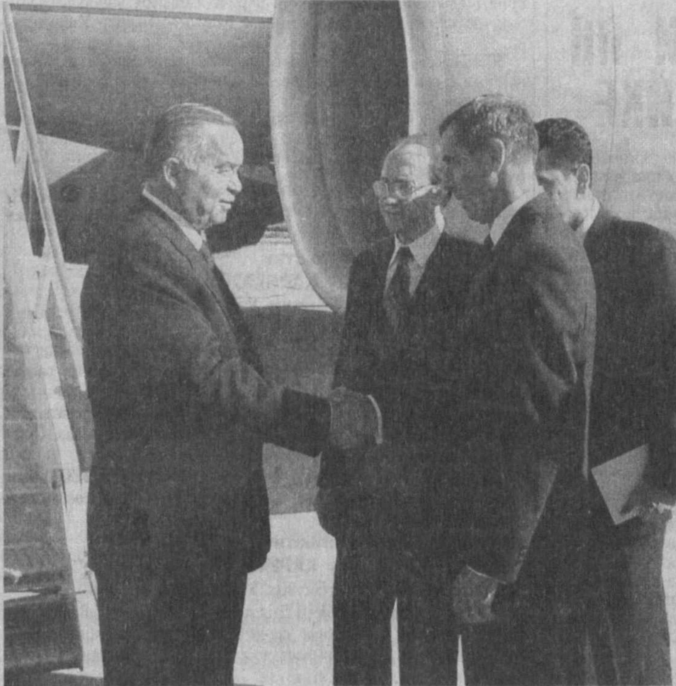
Перед отлетом в Нью-Йорк в Ташкентском аэропорту Президент Ислам Каримов в своем интервью журналистам особо остановился на этом вопросе.

Президент Республики Узбекистан Ислам Каримов 7 сентября отбыл в Нью-Йорк для участия в «Саммите тысячелетия ООН».