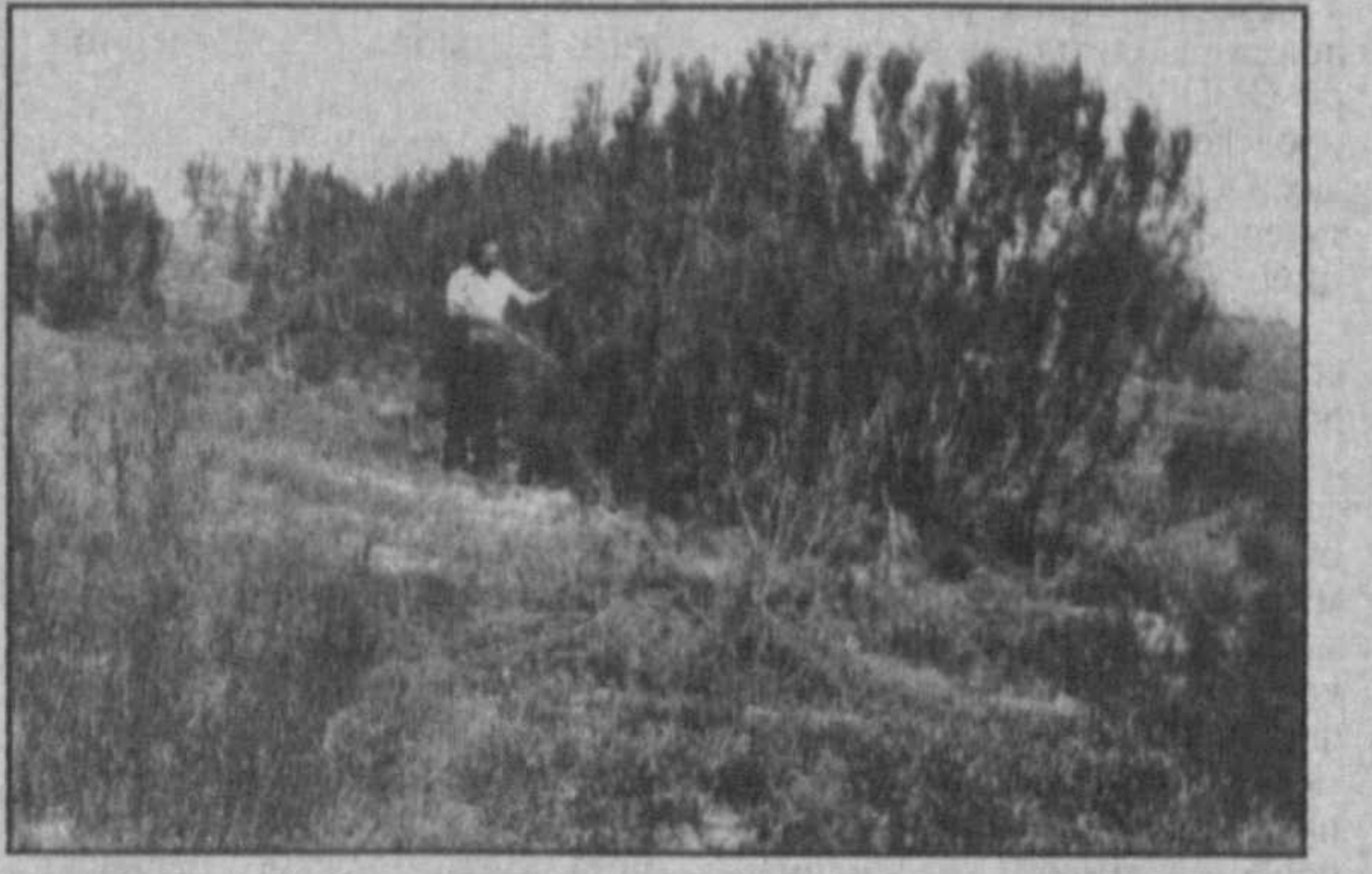
1984—1999 гг.), создание защитных лесных насаждений на осушенном дне Аральского моря преследует три цели: во-первых, оздоровление экологической обстановки с помощью растительности, которая выделяет кислород и поглощает углекислоту, а также собирая на своей поверхности пыль, приводит к резкому уменьшению заболеваемости местного населения; во-вторых, создаваемые лесные насаждения своими корнями скрепляют почвогрунты и сводят к минимуму вынос соли, пыли и песка, а это тоже позволит иметь чистый воздух; в-третьих, создаваемые лесные насаждения поможут образованию новых пастбищ, чтобы в последующем осушенное дно использовалось в хозяйственном обороте, что будет способствовать обеспечению жителей Приаралья продуктами животноводства. На

в рещении аральской проблемы. Одной из таких стран является Германия. Немечка сторона считает, что в международном плане эта проблема носит глобальный характер. Узбекские и немецкие специалисты едины в понимании важности проведения лесомелиоративных работ на осушенном дне Аральского моря. Достаточно отметить, что из 365 тысяч в году около 300 по Приаралья тупают печеные солевые бури. С осушенного дна ежегодно в воздух поднимается до 75 млн. тонн песка и пыли, а на 1 га сельхозземель выпадает 520 кг соли, которые несут огромный урон процессу возделывания культур и приводят к засолению поливной земли. Песок и пыль, распространяющиеся в атмосфере, — это еще не самое страшное, значительную часть осушенной территории Арала составляют неподходящие никому орошаемые солончаки, с которых в воздух поднимаются огромные количества ядовитой соли, образующие настоящие облака, колющие на большие расстояния, достигающие Западной Европы. Уменьшить их вредное воздействие можно единственным путем — локализовать с помощью защитных лесных насаждений из пустынных растений. Очистить воздух, насытить его кислородом и снизить в нем количество углекислоты как раз способны будущие лесные насаждения, создаваемые как вокруг населенных пунктов, так и на осушенном дне Аральского моря — в том числе и по совместному немецко-узбекскому проекту. Как установлено учеными Узбекского научно-исследовательского института лесного хозяйства (З. С. Новикий,