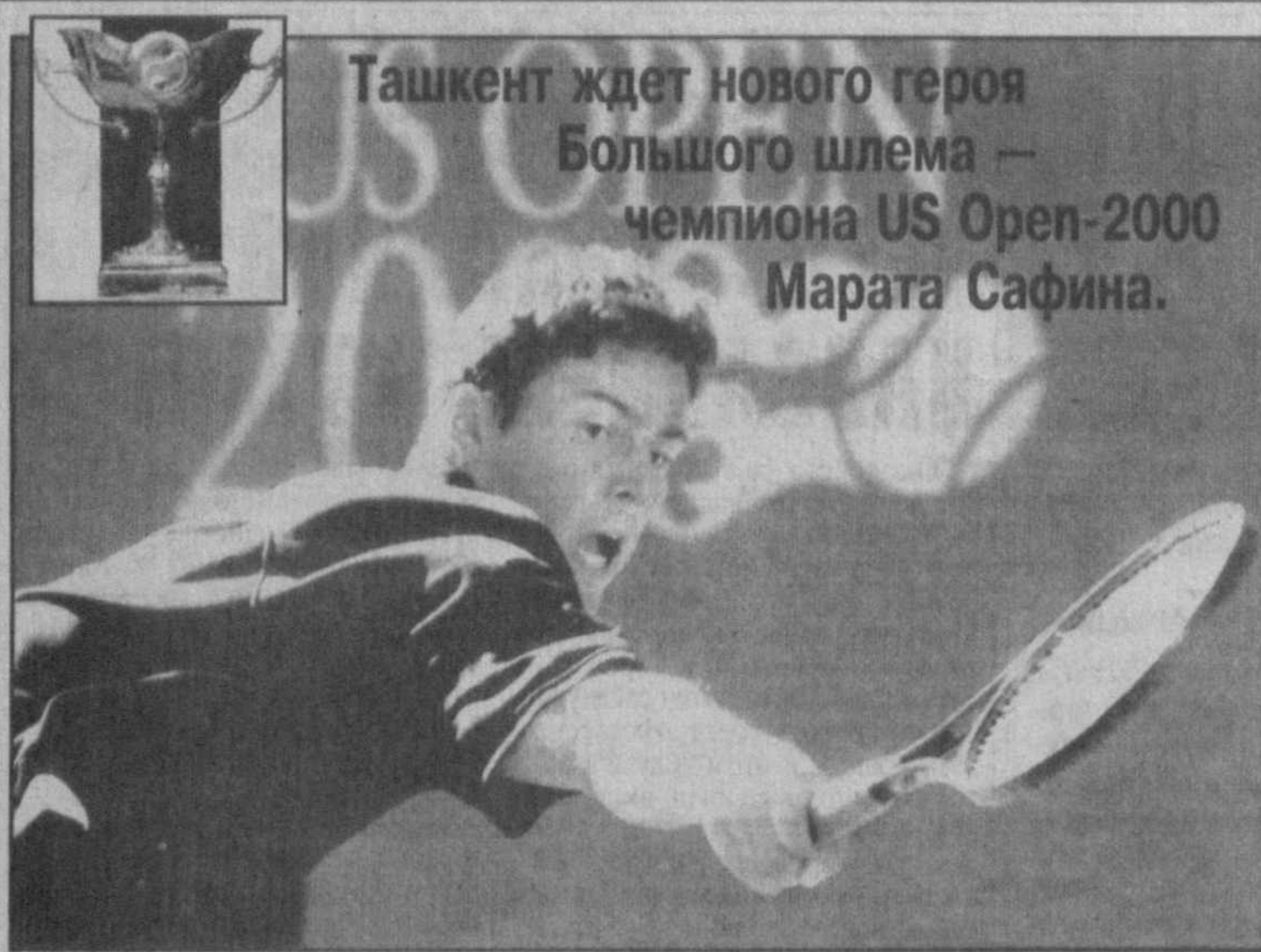
Ташкент ждет нового героя Большого шлема — чемпиона US Open-2000 Марата Сафина.

Год за годом этот турнир, приходя на землю Узбекистана следом за торжествами в честь государственной независимости, словно символизирует собой обретенную нашей страной вместе с независимостью открытость миру и готовность приобщаться к истинным мировым ценностям, одной из которых является спорт