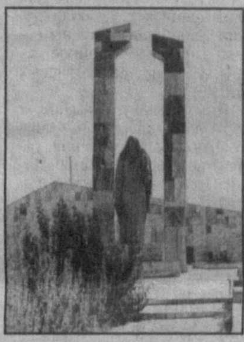
Именно такую обстановку можно наблюдать в кооперативном хозяйстве «Жейнов», расположенном в Усман Юсуповском районе, что в отдаленной южной части Каршинской степи. За последние десять лет облик хозяйства полностью преобразился. Появилось множество современных зданий. В частности, открыты Дворец искусств на 600 мест, построены более ста жилых домов, современные больницы, 4 школы, 3 детских сада, дехканский рынок «Жейнов», двухэтажная чайхана, торговые центры

В акционерном обществе «Кизилтекинский хлопкоочистительный завод» состоялась встреча, посвященная приему первых тонн хлопка нового урожая. В нынешнем году в районе на 10 тысячах гектаров выращен хороший урожай, и с каждого гектара можно получить по 28 центнеров сырья. В этот день более 50 тракторов с прицепами, груженными хлопком, прибыли на завод. Пятнадцать кооперативных и фермерских хозяйств сдали около 500 тонн хлопка.