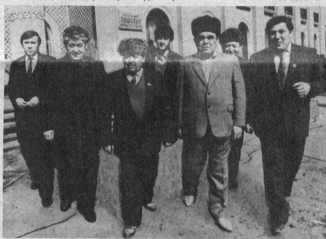
НА СНИМКЕ: участники курултая работников АПК из Навоийской области.