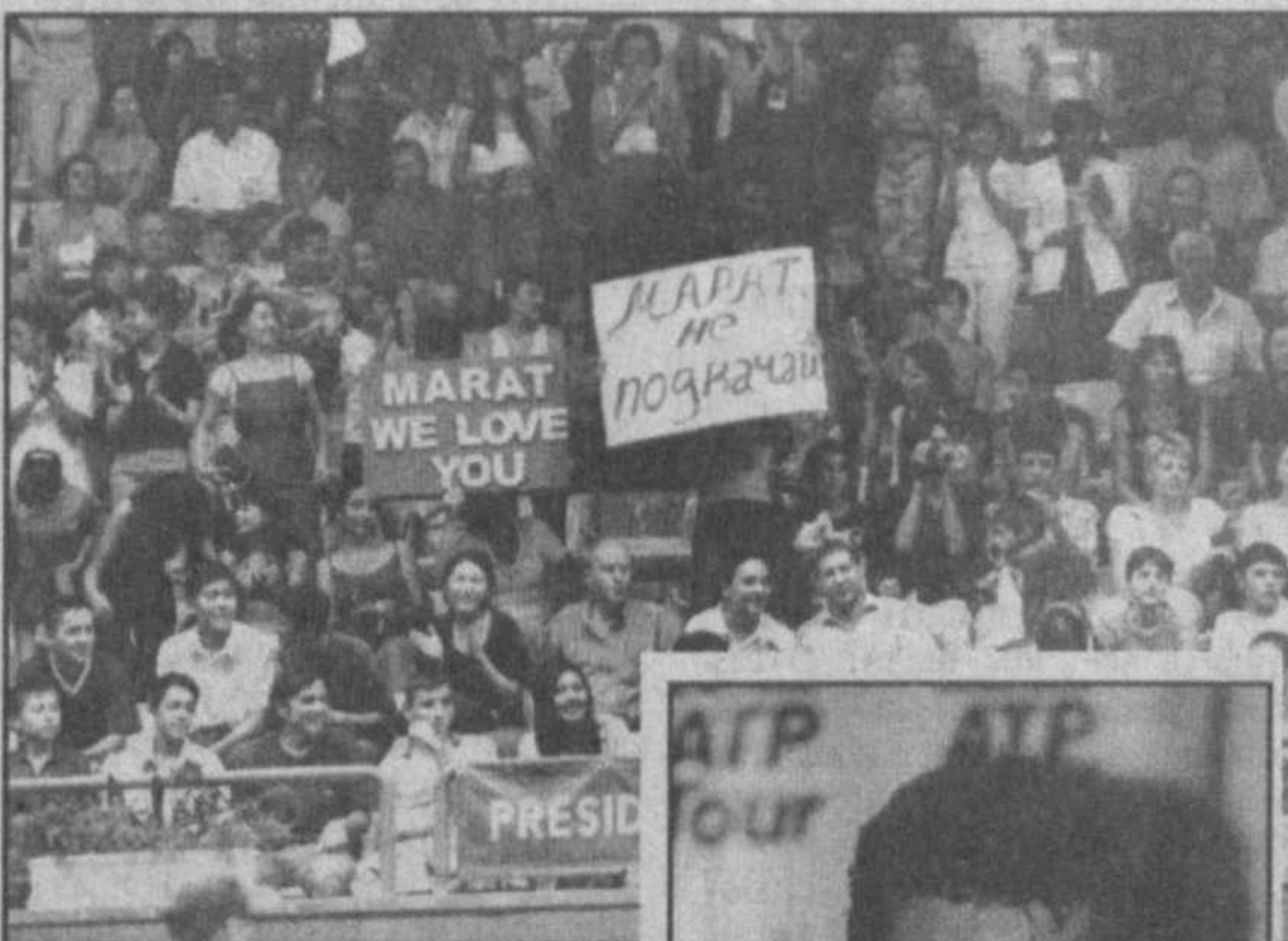
Сергей ДАНИЛОВ, наш корр. Марат Сафин

Только из боязни сглазить не стану утверждать, что Марату Сафину открыта дорога к победе в VII Кубке Президента и, как следствие, к лидерству в ATP Champions Race 2000, — чемпионской гонке, на финише которой в конце сезона победителя ждет титул первой ракетки мира.