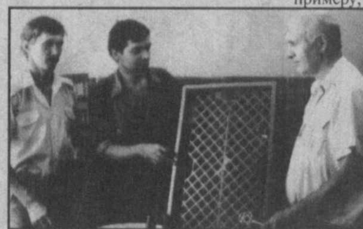
директских изделий. В тот год коллектив предприятия приобрел новый фрезерный станок с программным управлением, закупил металл, полиэтиленовые гранулы, изготовил две пресс-формы, арендовал термостат и приступил к производству тары.