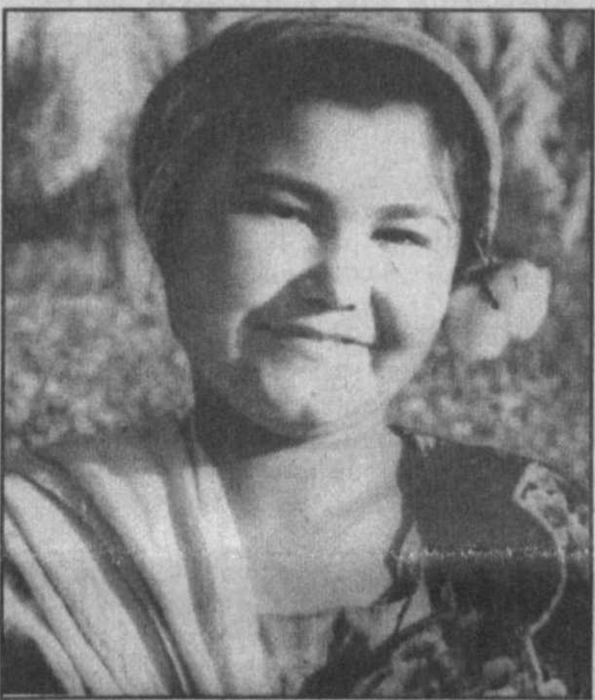
хлопкосеющих регионов страны. Здесь под хлопок отведено более ста четырех тысяч гектаров.

Джизакская область считается одной из самых крупных