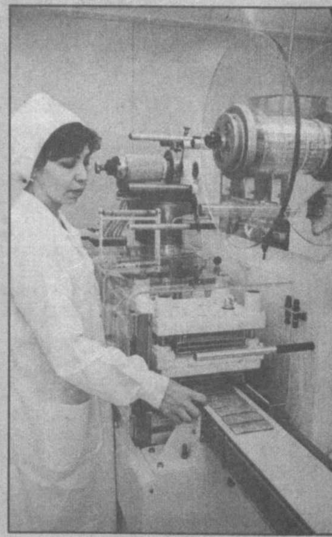
Сегодня СП, созданное по инициативе "Тамед" — дочернего предприятия известной германской компании "Сана-Витта", работающей на рынках восточных стран, — и акционерного общества "Узхим-Фарм", поставившее в аптечную сеть республики антибиотики, лекарства для лечения инфекционных и ревматических заболеваний, аллергии, бронхиальной астмы.

научной мысли, поскольку собрал ведущих специалистов мира. В работе конференции приняли участие более 300 ученых из США, Узбекистана, Японии, Италии, Турции, Китая, Германии, Нидерландов, Канады, Франции, России, Казахстана и других стран. Они познакомили друг друга с результатами своих новейших исследований, которые практически нигде не были опубликованы. Еще одним итогом форума в узбекской столице, по мнению профессора из Милана, стало решение его участников о регулярном проведении подобных конференций раз в два года. Кроме того, ученые наметили в промежутках между встречами выпускать журнал в электронном виде, получивший условное название "Интеллектуальные системы в промышленности", где будут освещаться результаты самых последних научных разработок.