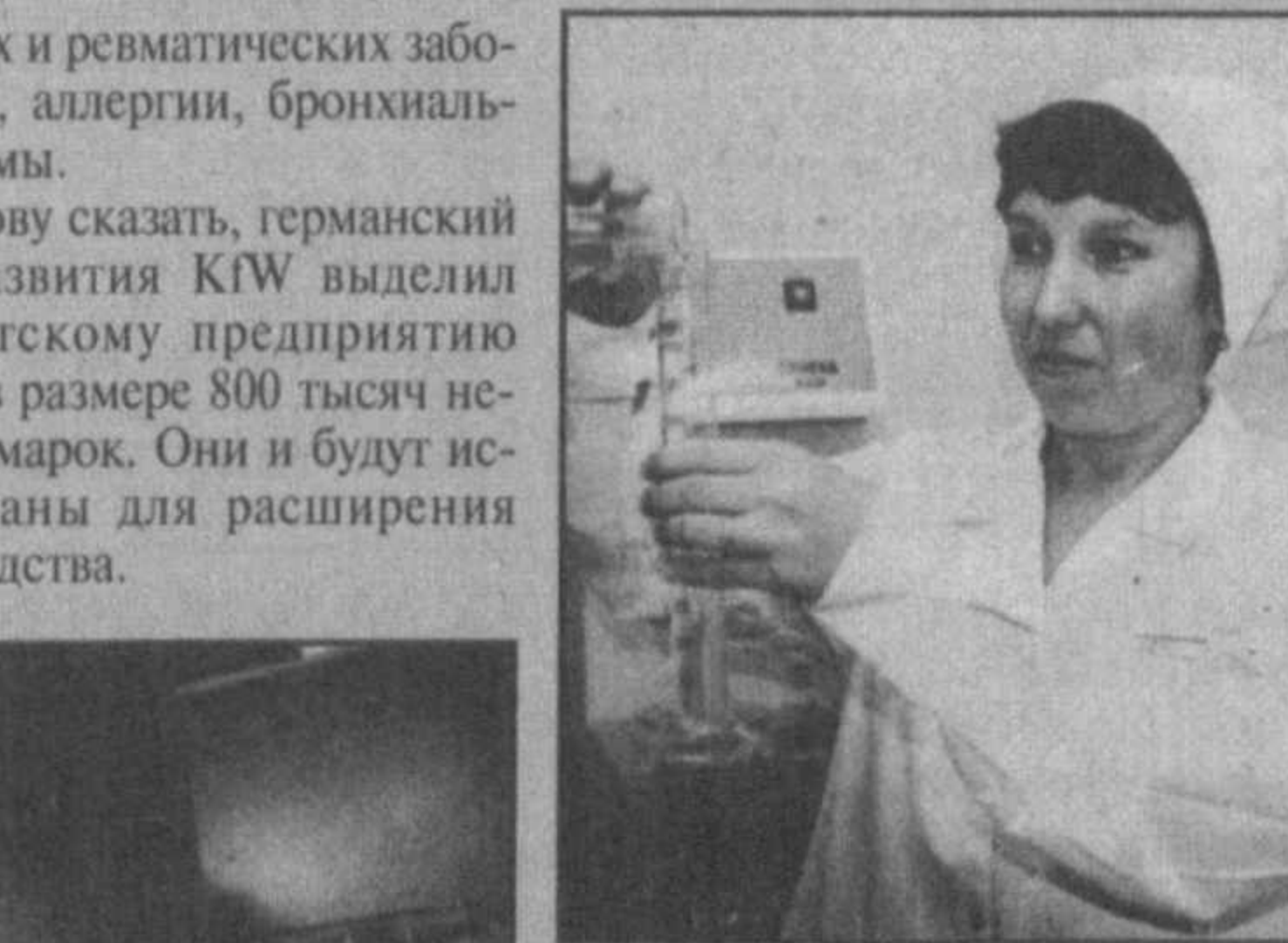
НА СНИМКАХ: контроль за качеством выпускаемых лекарств на СП "Таш — Тамед Фарма Лтд." очень строгий. Здешние специалисты прошли обучение непосредственно на производстве.

Действующее в столице республики совместное узбекско-немецкое предприятие "Таш — Тамед Фарма Лтд." приступает к выпуску новых видов лекарственных препаратов. Они будут использованы в борьбе с таким опасным заболеванием, как туберкулез. Это первый этап расширения производства, предусматривающий изготовление в нашей стране большого ассортимента медикаментов.