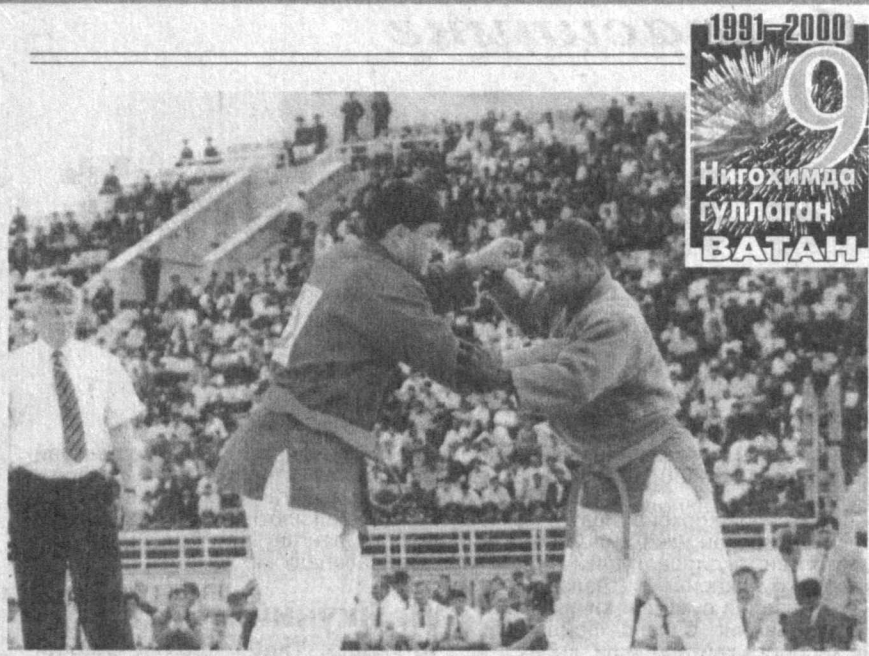
1991-2000 9 Нигоҳимда гуллаган ВАТАН